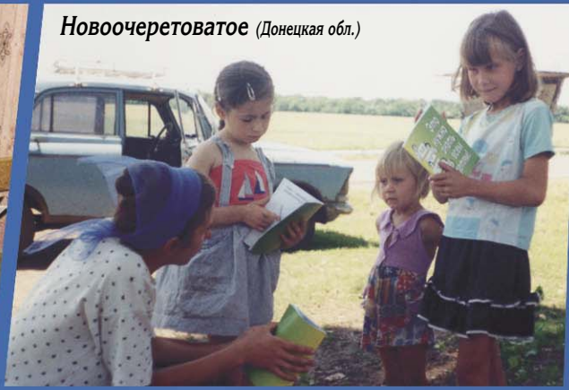
Новоочеретоватое (Донецкая обл.)