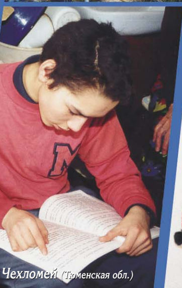
п. Чехломей (Тюменская обл.)