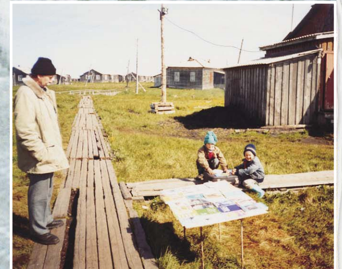
Библиотечное служение на краю земли (о. Колгуев)