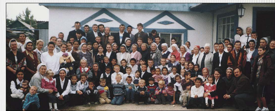
Община МСЦ ЕХБ города Актобе у молитвенного дома

«Слава Богу, что мы находимся в братстве МСЦ ЕХБ!» — с благодарностью сообщают верующие церкви города Актобе и радуются возможности свидетельствовать гонителям об Иисусе Христе — единственном Спасителе грешников. Хотя суды заканчиваются вынесением