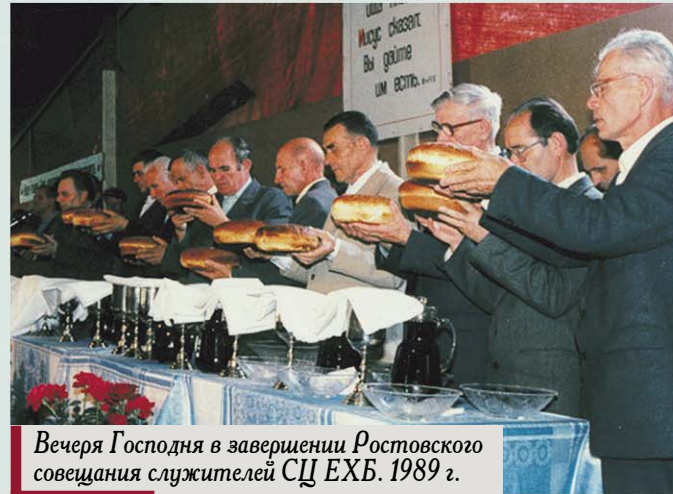
Вечеря Господня в завершении Ростовского совещания служителей СЦ ЕХБ. 1989 г.

Если нашему Господу так дорого было, чтобы в веках не осталась в забвении Его невинная Кровь, пролитая за грехи человечества, то