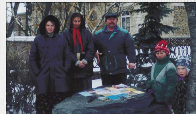
Библиотечное служение многим принесло спасение (с. Новораиц)