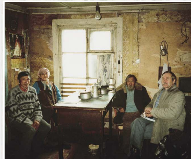
Посещение по домам с евангельской вестью (о. Колгуев)