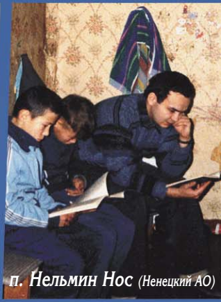
п. Нельмин Нос (Ненецкий АО)