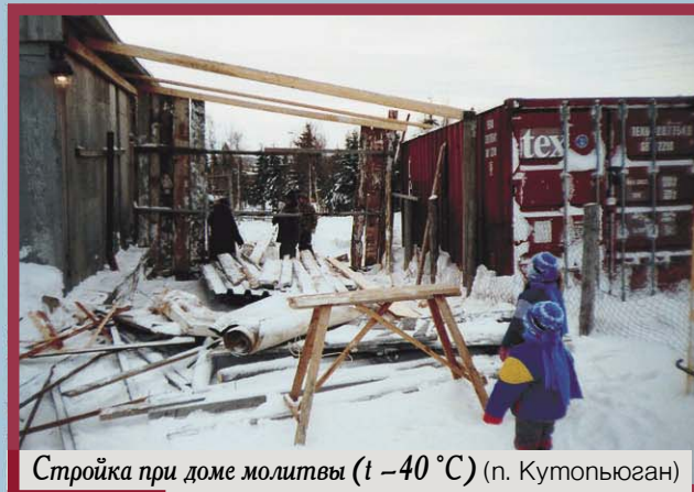
Стройка при доме молитвы ( t -40^{\circ}\text{C} ) (п. Кутопьюган)