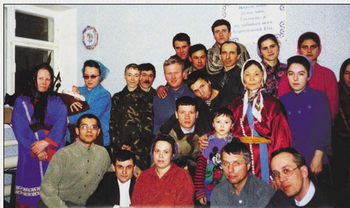
После служения в церкви поселка Угут