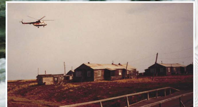
Для островитян поселка Бугрино вертолет — единственный вид транспорта попасть на материк