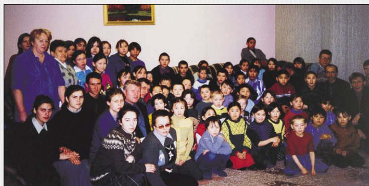
Радостное свидетельство о Господе в ненецком интернате поселка Тарко-Сале

в пути к следующим селениям. Отдыхали тут же в микроавтобусе. В какую бы местность ни прибыли — ходили от дома к дому и приглашали послушать Слово Божье, а вечером совместно с церковью проводили богослужения, которые посещали разочарованные жизнью удрученные грешники, живущие в рабстве алкоголя и наркотиков.