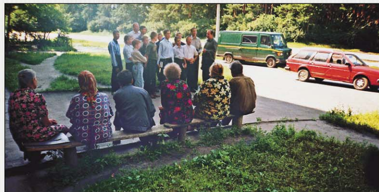
«Премудрость возглашает на улице... голос свой» — кто примет весть спасения, обретет жизнь вечную!