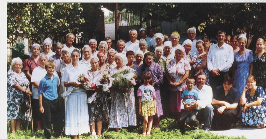
Дав обещание Богу в день крещения, сохраните Ему верность! (с. Новокаирь)

На большом камне раскладываем христианскую литературу. Многие берут читать и, несмотря на угрозы противящихся, познают радость спасения.