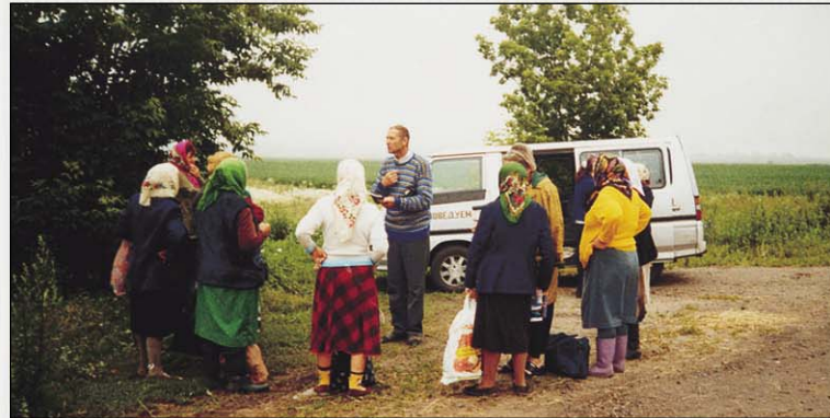
«Пойди по дорогам и изгородям и убеди прийти» (п. Пробожье)

тельными и активными участниками служений были дети. В селах: Коробкино, Осоцкое, Молотычи Фатежского района весть об Иисусе Христе, Спасителе всех человеков, прозвучала тоже. Людей убеждали оставить неверие, раскаяться в грехах. Пожилых спрашивали: всё ли они приготовили для перехода в вечность? Как выяснилось, только одежду, да доски на гроб. А о том, что нужно уходить с земли с чистым сердцем, примирившись с Богом через покаяние, люди не ведали, и об этом не думали. Помилуй их, Господи, чтобы после многих разъяснений и призывов к покаянию они обратили сердце к поиску истины для спасения грешной души!