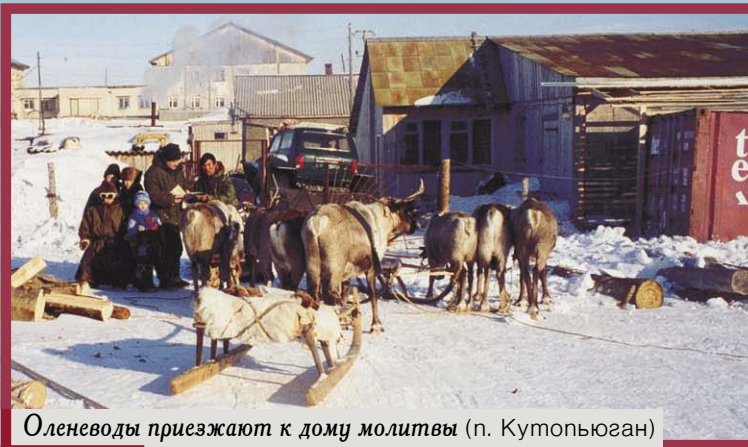
Оленеводы приезжают к дому молитвы (п. Кутопьюган)

Намереваясь заехать в заброшенный поселок Хоровая (там