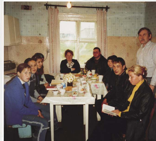
Благовестие вечного спасения (о. Колгуев, п. Бугрино)

«Пошлю спасенных...», то есть тех, кто верой принял Христа в свое сердце. Кто возрадовался во спасении сам и понял, что точно такие же грешники, влача греховное бремя, томятся и ждут: когда же придут к ним Божьи посланники, чтобы пригласить и их на торжественный пир Спасителя и Господа Иисуса Христа. Благодарение Богу, что и на остров Колгуев, расположенный в юго-восточной части Баренцева моря, пришли благовестники и с любовью рассказали островитянам о их личном Спасителе.