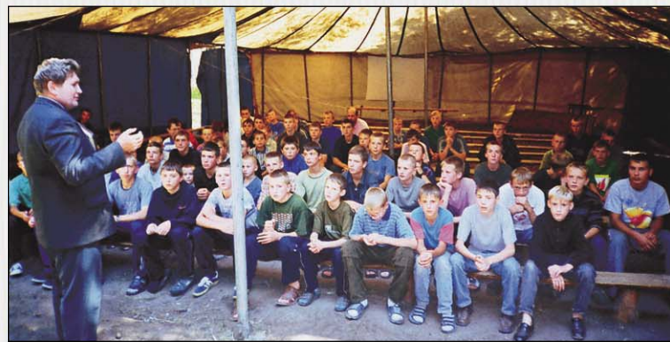
Христианский лагерь для подростков. Звучит призыв посвятить Богу юные годы жизни