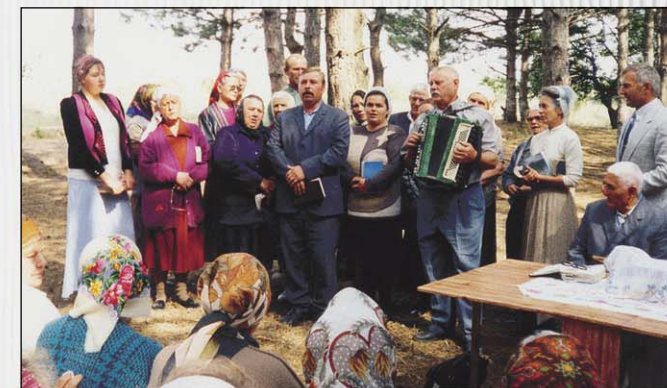
Получив спасение, возвещают другим! (с. Новокаирь)

В селе Новораиц проводим библиотечное служение.