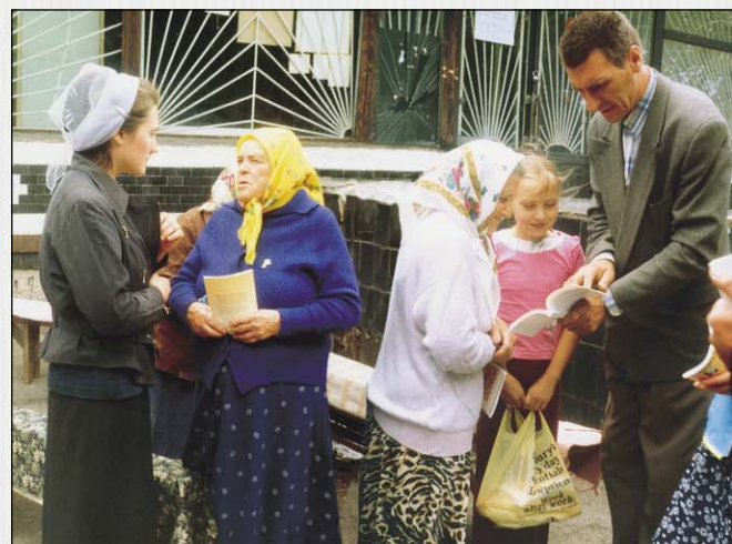
Каждому вручают Евангелие или христианский трактат (с. Вапэрьяновка, Донецкая обл.)

Христос в свое время проповедовал, несмотря на противодействия. «Впрочем, Мне должно ходить сегодня, завтра и в последующий день...» (Лук. 13, 33). По Его примеру проповедуют Евангелие вчера, сегодня и завтра и ревнующие о благовестии в Донецкой области. Шестиве Евангелия никто не остановит до того дня, когда Святой, Истинный, имеющий ключ Давидов, не закроет дверь для благовестия. А пока еще время благодати длится, нам должно ходить из села в село, из города в город сегодня, завтра и во все последующие дни!