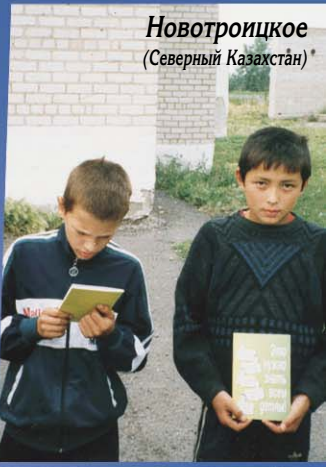
Новотроицкое (Северный Казахстан)*