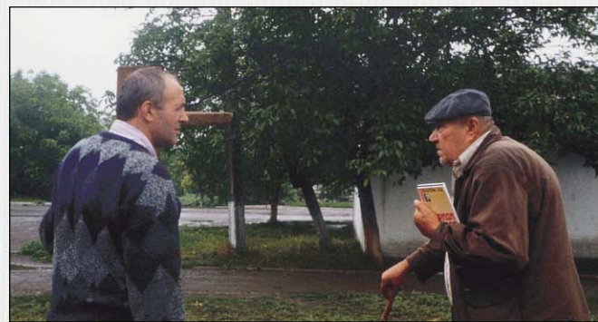
Каждого убеждают принять спасение (с. Свободное, Волновашский р-н Донецкая обл.)