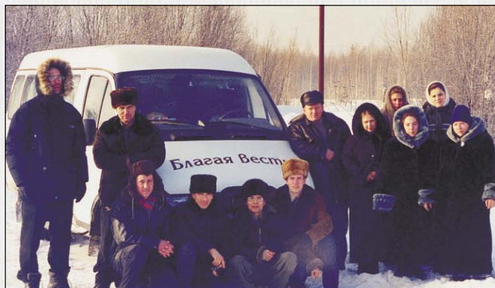
На этом микроавтобусе группа молодежи проехала 7 тыс. км с благовестием по северным широтам

На микроавтобусе 6 молодых братьев и 5 сестер, а также благовестник и диакон Давлекановской церкви за две недели посетили 14 церквей и групп и провели 24 служения. Днем общались с народом Господним, ночь были