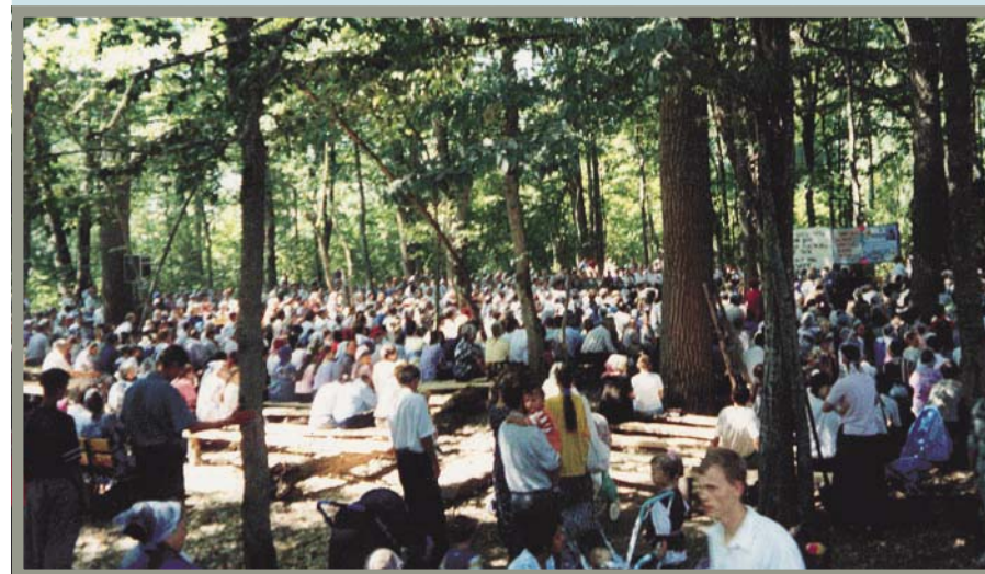
Места достаточно всем (Юбилейное общение, Краснодарский край)