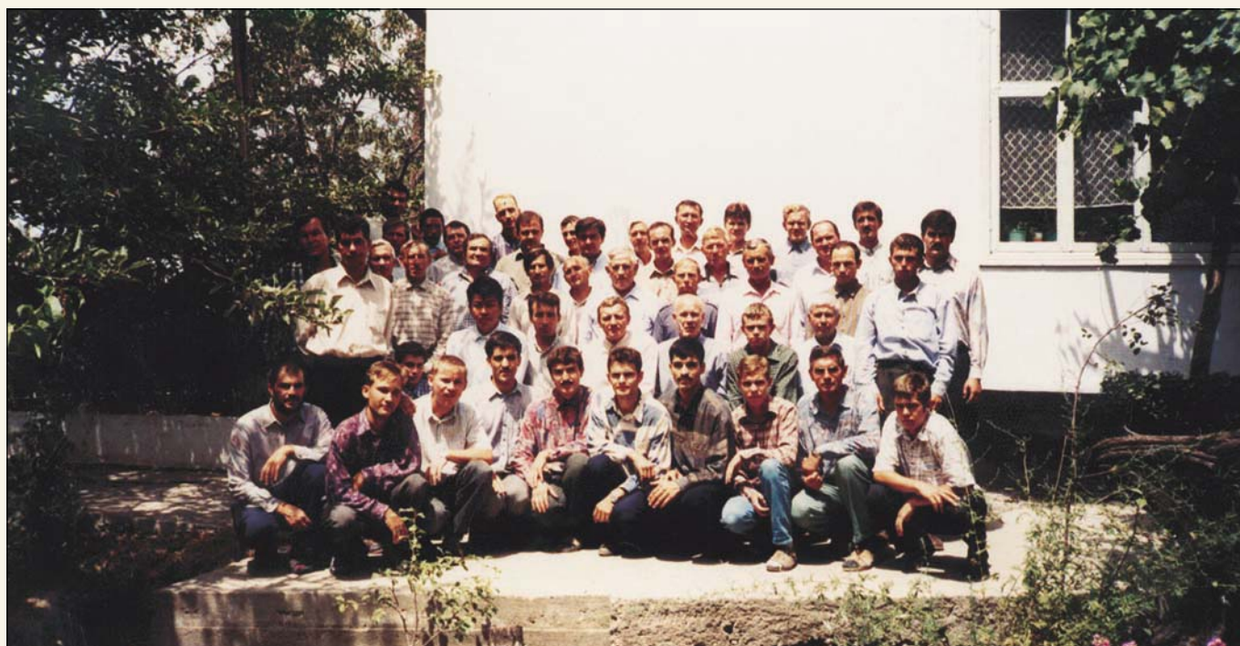
Они были «на злачных пажитях» (Общение проповедников, г. Кызыл-Кия)