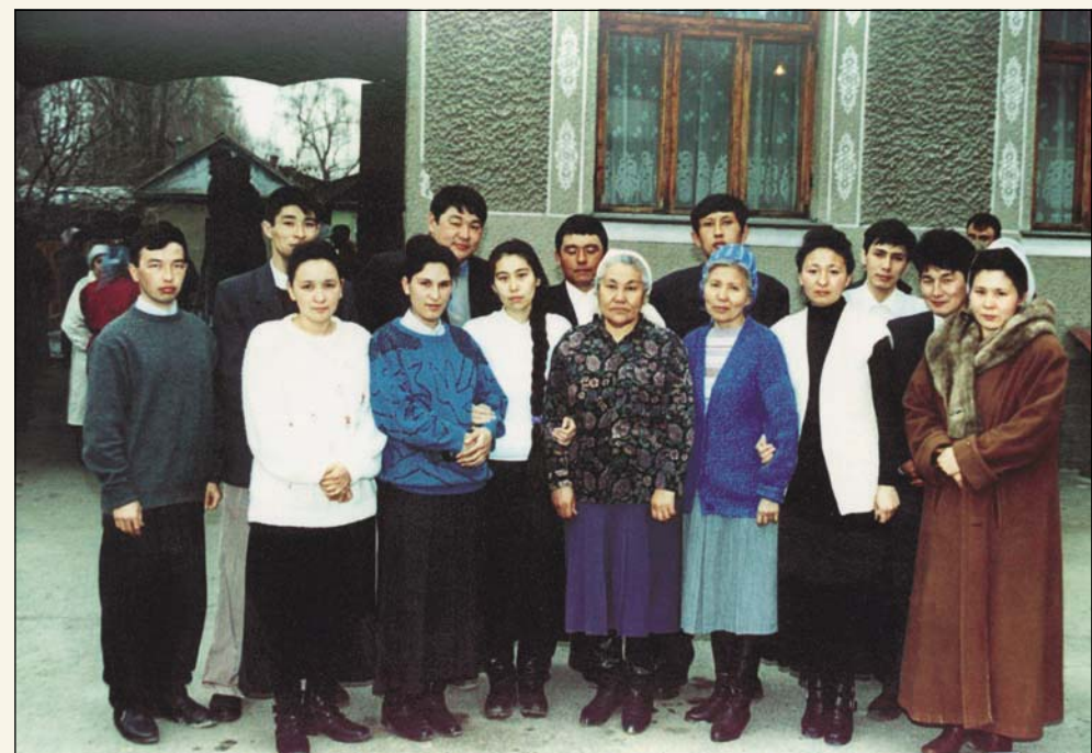
Взятые в Божий удел (Алма-Атинское объединение)

«Я отворил пред тобою дверь, и никто не может затворить ее...» (Откр. 3, 8). Дверь благовестия, открытая Самим Богом, не затворилась и в Средней Азии, хотя много противников, желающих ее закрыть. В Казахстане за проповедь Евангелия и проведение богослужений верующих штрафуют, избивают, судят, некоторых помещают в психбольницу. Слово Апостола Павла Тимофею: «Страдай с благовестием»