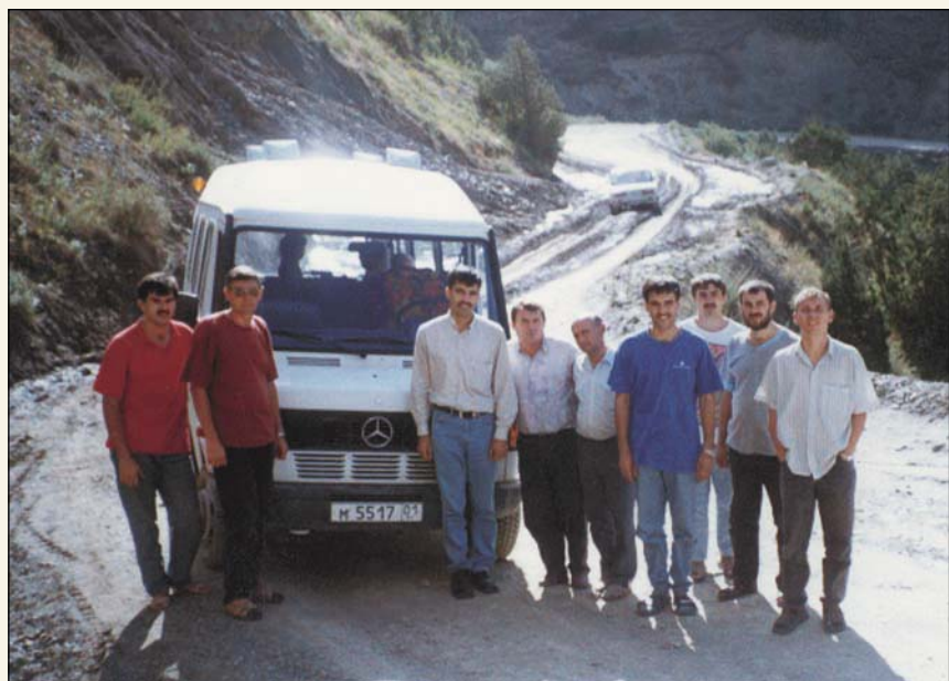
Еще не все трудности позади (Проповедники в пути)

Новых групп в южном регионе образуется очень мало. Поток миграции и эмиграции, увлекающий население, не обходит и церковь: десятки семей уезжают. Братья озабочены тем, чтобы не только сохранить в городах и поселках то, что создалось с большим трудом, но и приобретать новые души, нести весть о спасении туда, где она еще не звучала.