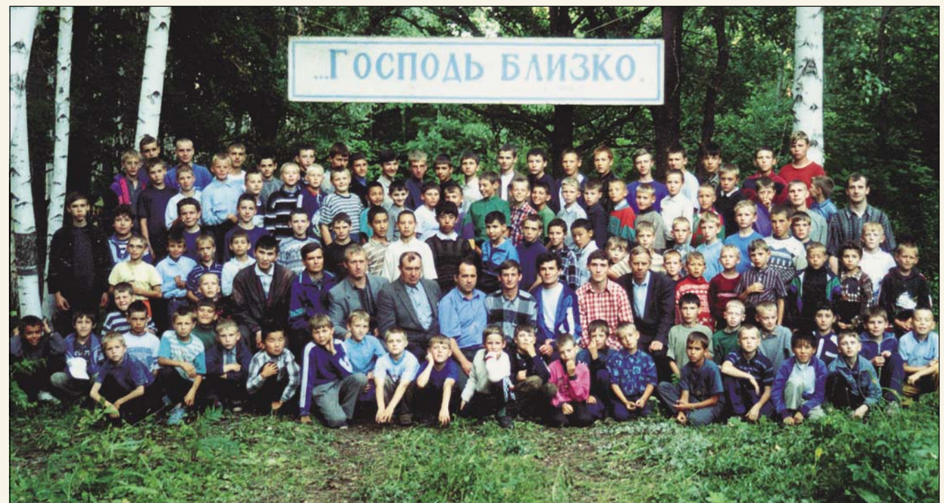
«Виноградник в цвете» (Христианский лагерь, г. Отрадный)

Нередко благовестникам приходится встречать ожесточенное сопротивление злых духов, которые не хотят отпускать свои жертвы. В такой ситуации тем более при-