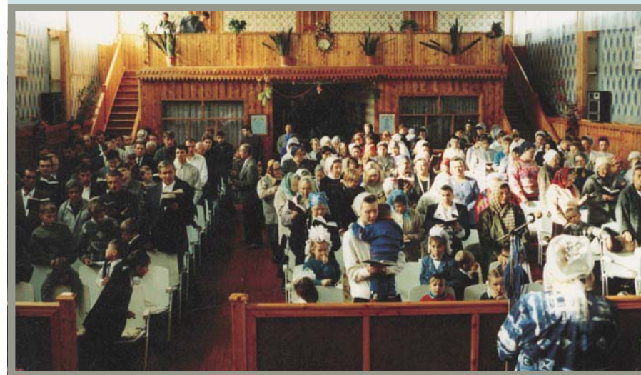
Бог достоин хвалы (Юбилейное общение, г. Нижневартовск)

обетованной земли. Перед ним стояло общество народа Божьего, рожденное в пустыне, и он строго предостерегал: «Берегитесь, чтобы не забыть вам завета Господа, Бога вашего...» (Втор. 4, 23). И далее напоминал: «Вот у Господа, Бога твоего, небо и небеса небес, земля и все, что на ней, но только отцов твоих принял Господь и возлюбил их, и избрал вас, семя их после них, из всех народов...» (Втор. 10, 14—15).