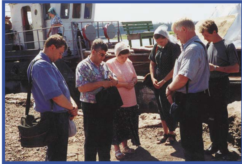
Все начинается с молитвы (Перед благовестием)

ка... Помолвившись Богу об охране, труженики уснули. Бог дал покой, хотя звери были очень близко. Встреча с медведем в тайге весьма опасна: он быстро плавает, лазит по деревьям и бежит со скоростью 45 км в час.