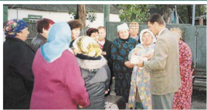
Они узнали о Христе — Спасителе! (Краснодарский край)