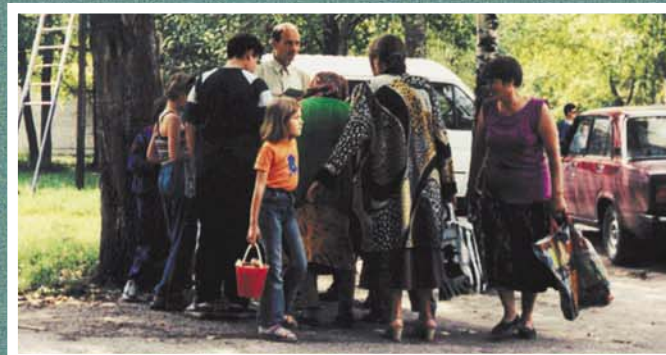
Спасение еще возвещается! (Мордовия)

Духовно-назидательный журнал Международного союза церквей евангельских христиан-баптистов