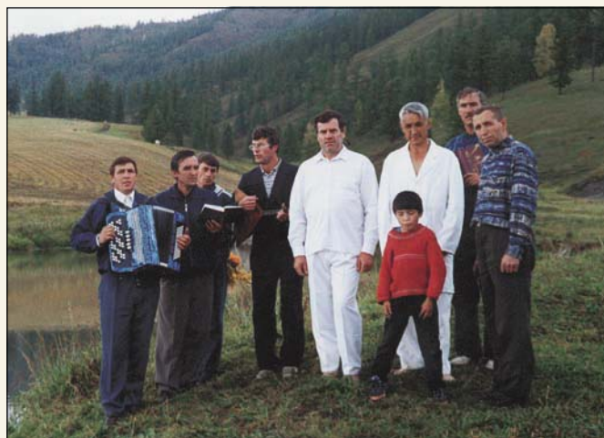
Первый «живой камень» среди алтайского народа (Горный Алтай)