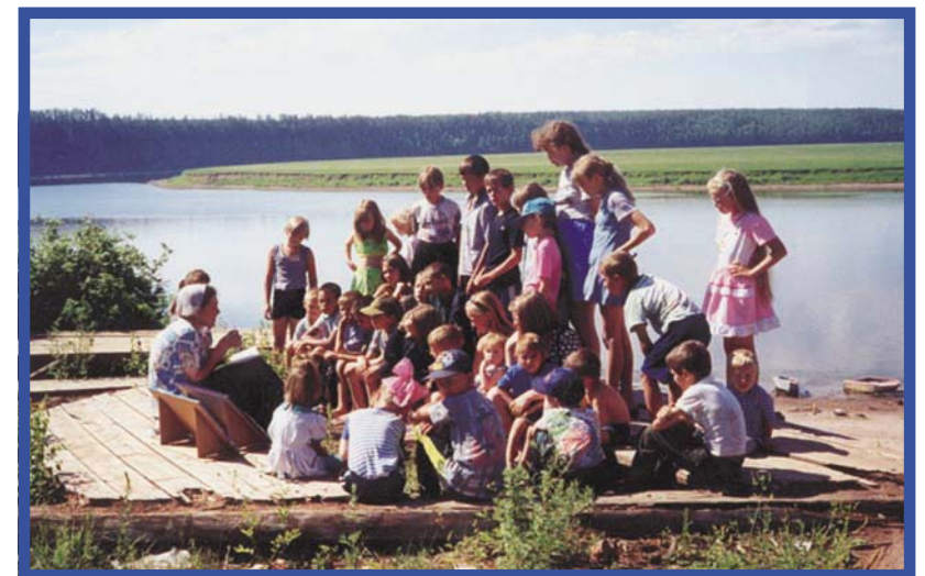
Великие истины — малым (п. Макарово)