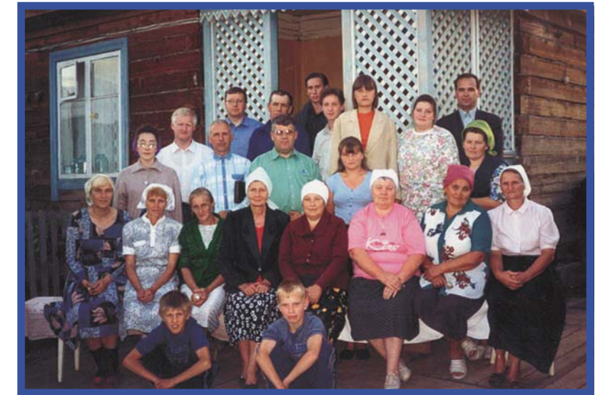
Они приняли весть спасения (п. Заярное)

Молодая женщина, мать двухлетнего ребенка, с ранней юности искала Бога