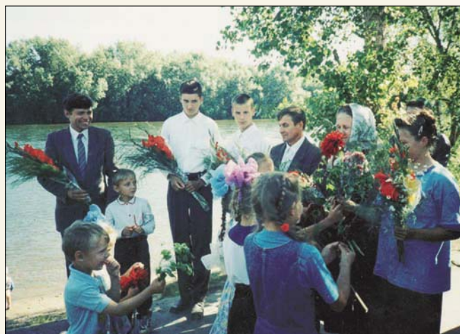
Праздник спасенных (г. Канск)

Есть на Енисее поселок Курейка. Его можно назвать «комариное местечко». Переехал туда на жительство брат, в семье которого трое маленьких детей. Служитель, посетивший их, рассказывает: «Суровая и долгая зима здешних мест с почти круглосуточной темнотой делает неопишимо долгожданными теплые летние дни. Но вот парадокс: когда они приходят — радоваться почти не приходится. Невиданное множество кровожадных насекомых делают жителей пленниками жилищ. Дети от укусов покрываются красными пятнами, словно от кори. Пошел я с братом косить сено для коровы и понял: находиться вне дома можно, пока работаешь. Стоит только остановиться — комары нападают тучей, несмотря на то, что на голову надет накомарник и все открытые части тела смазаны специальной мазью. Пить приходится через сетку, так как поднять накомарник нельзя — тут же залетает бесчисленное множество этих кусающих существ. Тех комаров, которые уже попали под накомарник, нужно просто перетерпеть, освободиться от них невозможно.