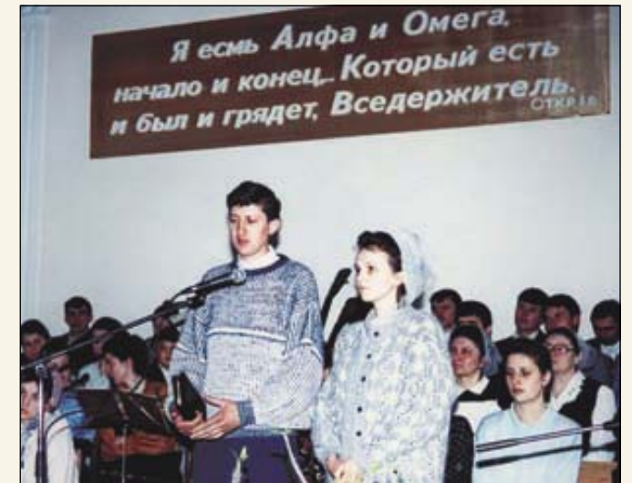
Господь позвал на служение. И они пошли. (Алма-Атинское объединение)

Особенно отличилось свидетельство о Боге в Аягузе. На судебный процесс над одним из братьев христиане шли, как на благовестие, как говорил Христос: «И поведут вас к правителям и царям за Меня, для свидетельства пред ними...» (Матф. 10, 18). Действительно, в зале суда присутствовали люди, которые отказались прийти на богослужение, когда их приглашали христиане. Теперь же и для них звучало Слово Божье во свидетельство. Услышав несправедные обвинения судьи и показания свидетелей, многие из сидя-