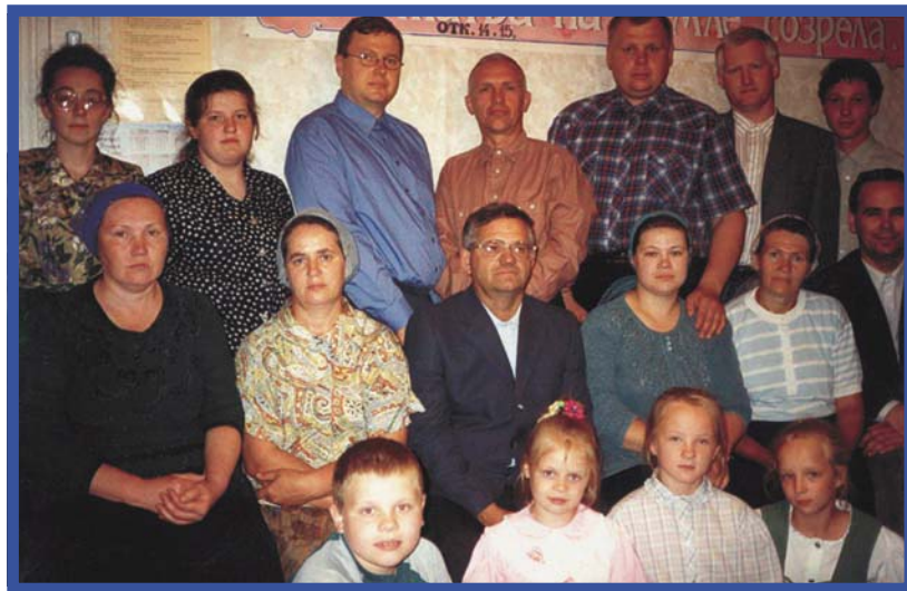
И в г. Усть-Кут горит светильник Божий (Группа верующих с благовестниками)

Немалые трудности создают благовестникам насекомые. В одном поселке было столько комаров, что брат, хлопнув в ладоши, сразу убил 16 штук!