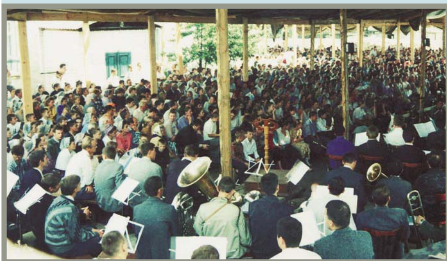
Есть за что благодарить Небесного Отца! (Юбилейное общение, г. Мерефа)

Служители братства сами шли путем очищения и освящения и нам его заповедали. Какими только едкими словами не было высмеяно это благословенное служение! И высмеивали его не враги, а так называемые христиане. Те же, кто не пренебрегал очищением своей души, от сердца скажут: это благословенный путь! Нам надо крепко держаться этого пути, чтобы удостоиться встречи с Господом.