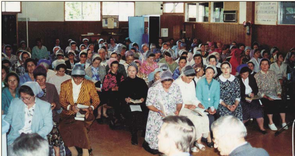
Они избрали благу часть (Общение сестер, г. Отрадный)

Ненцы и ханты с интересом слушают весть о живом Боге, об Иисусе Христе. Но чтобы научить их праведной жизни и утвердить в вере, нужно время, нужен упорный труд, нужно, чтобы кто-то ходатайствовал о них перед престолом великого Бога. Он же, любвеобильный, желает, «чтобы все люди спаслись и достигли познания истины» (1 Тим. 2, 4).