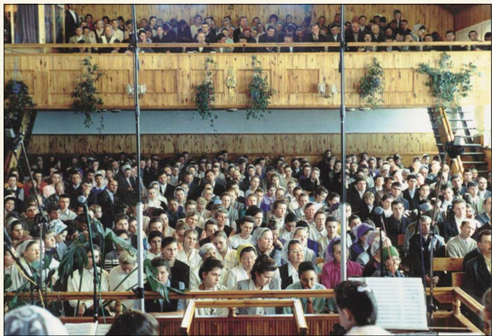
Блаженны слушающие и исполняющие заповеди Божьи (Общение по благовестию, г. Славгород)