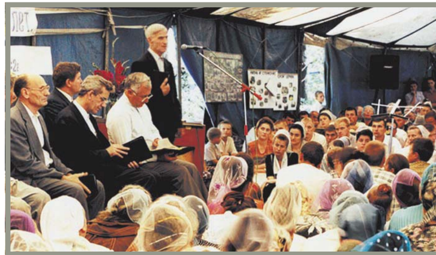
«Мы сильны верой» (Юбилейное общение, г. Курск)

Между сорокалетним путем израильского народа и нашим просматривается параллель. Невольно вспоминается трогательный момент, когда Моисей прощался с теми, кого вел, за кого ходатайствовал, кого любил. Он был один из немногих представителей старшего поколения, дошедших до пределов