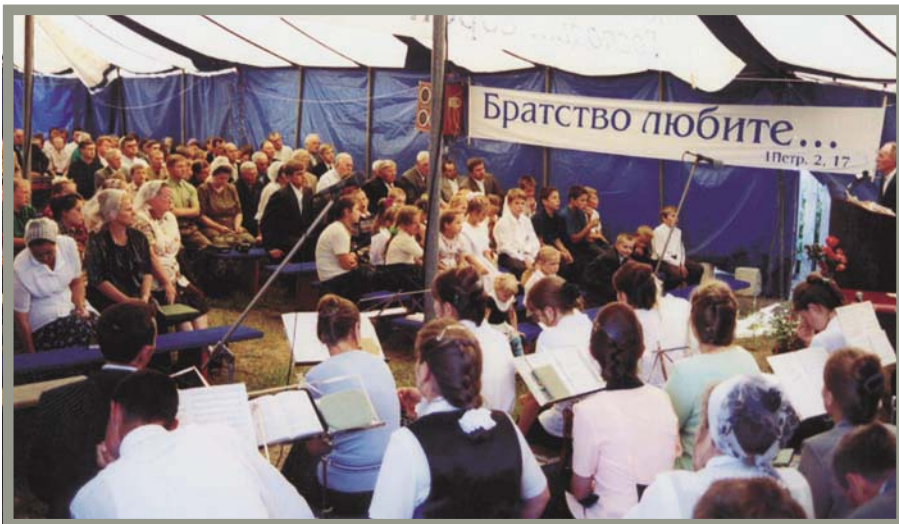
Любите братство! (Юбилейное общение, г. Кулунда)

Служители нашего братства сохранили народ Божий в единстве духа. Приходилось встречаться с братьями, которые осмеливались говорить: «Что братство?! Это не так важно!» Нет, нам передано единство на путях святости. Мы устояли в гонениях, потому что всем братством были единомышленны в стремлении угодить Богу, остаться послушными Его заповедям. Мы ходатайствовали друг о друге, поддерживали материально, сообща разделяли скорби, молились и постились друг о друге. Когда судили наших узников, братья и сестры ехали, порой, за 200—300 километров на общественном транспорте, чтобы постоять у дверей и помолиться, потому что в зал суда не впускали. На пути страданий можно устоять только в единстве духа с Богом и друг с другом.