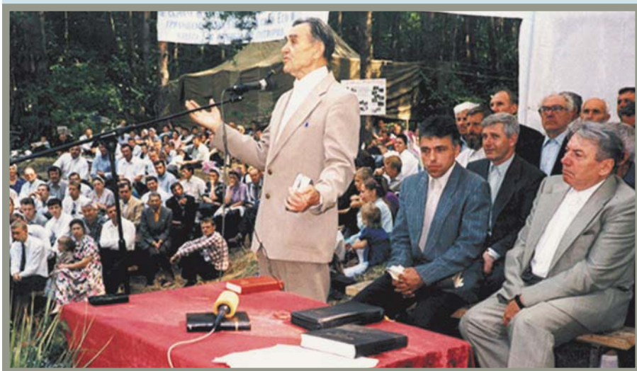
Они завещали нам верность (Юбилейное общение, г. Киев)