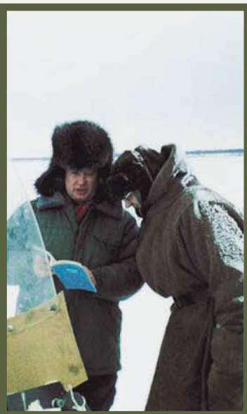
Всех зовите ко Христу! (Ненецкий автономный округ)

Это невероятно, тем не менее факт, что и в наши дни множество христиан отмечают пришествие Божьего Сына на землю, не имея Его в сердце! Их радует весть, что Бог явился во плоти, но лично в их жизни ничего не изменилось: они продолжают жить во грехах. Однако среди множества сторонних для Бога людей есть те, которые составляют «малое стадо» — живую Церковь Христа — и которые вместе со старцем Симеоном вдохновенно восклицают: «Видели очи мои спасение Твое!» (Лук. 2, 30). Они исполнены неподдельной радости, что быстрое течение времени неотвратимо приближает час, когда любящие Бога будут взяты от земли, чтобы узреть своего Жениха — Иисуса Христа — и навеки соединиться с Ним (Марк. 13, 36; 1 Фес. 4, 15–16)!