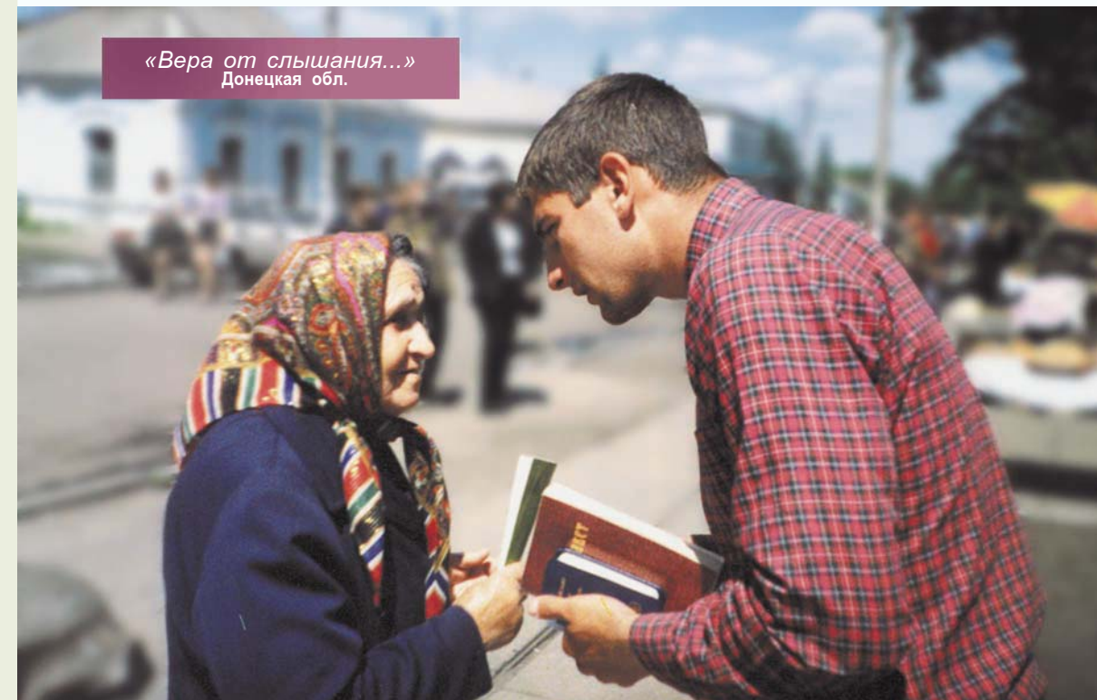
«Вера от слышания...» Донецкая обл.

Ты в Царство света смог ввести Сынов бездомных. Как осознать и как вместить Твою любовь мне?!