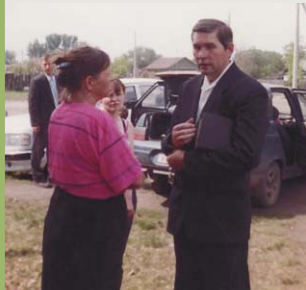
п. Мос, Челябинская обл.