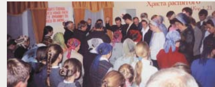
Дом молитвы в п. Зорино и первое торжественное служение в нем.