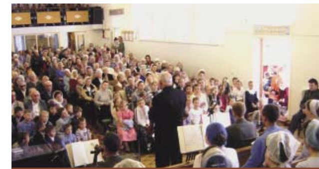
Евангелизационное служение в молитвенном доме Магнитогорской общины МСЦ ЕХБ.

Где дома молитвы не могли вместить слушателей, мы совершали богослужение во дворе или в арендованных