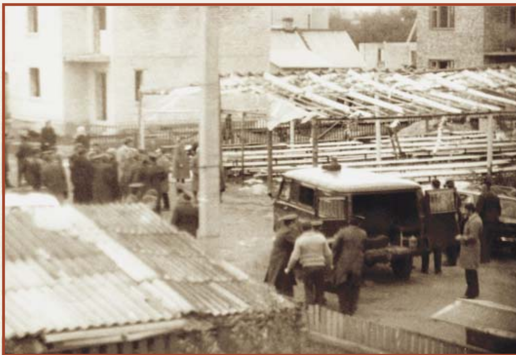
Празднование дня Жатвы завершилось разрушением палатки. 1985 г.

У меня было предчувствие, что мне тоже придется пройти через узы. Живя дома, я часто