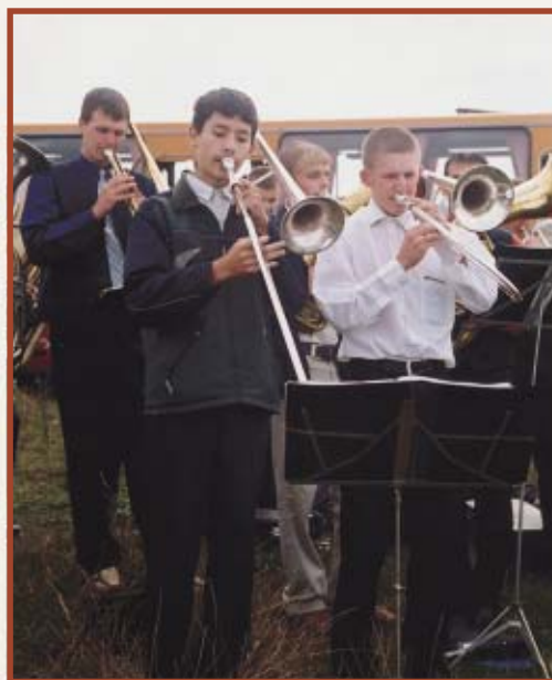
Бог, прилагающий спасаемых к церкви, достоин хвалы.