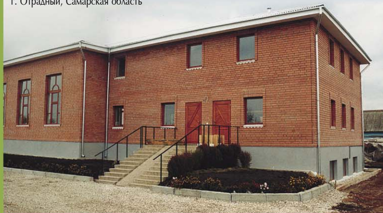
Новый молитвенный дом общины МСЦ ЕХБ. г. Отрадный, Самарская область