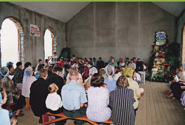
Вместо сожженного Бог помог воздвигнуть новый молитвенный дом! поселок Эльбан, Хабаровский край