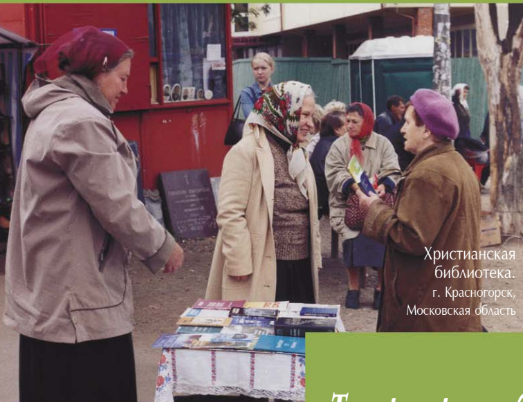
Христианская библиотека. г. Красногорск, Московская область