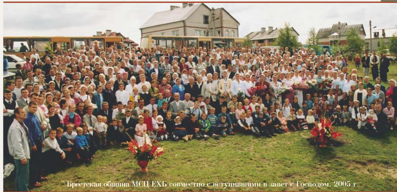
Брестская община МСЦ ЕХБ совместно с вступившими в завет с Господом. 2005 г.

проповеди, стихотворения, пение звучало и из уст молодых христиан. Служители призывали молодое наследие церкви не стремиться к обогащению, но быть жертвенными в труде на ниве Божьей (Рим. 121, 1—2) и посвящать себя в полное распоряжение Господу. По вечерам молодежь благовествовала в близлежащих деревнях. Свидетельство о Христе прозвучало для многих жителей.