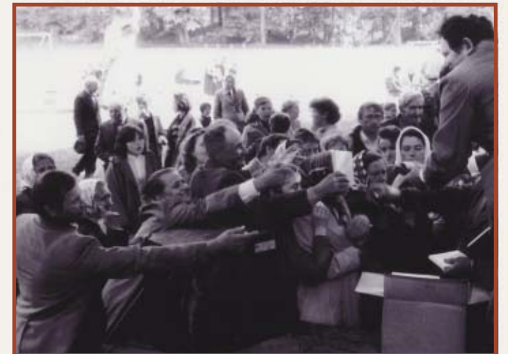
Благовестие в Высоком. 1990 г.