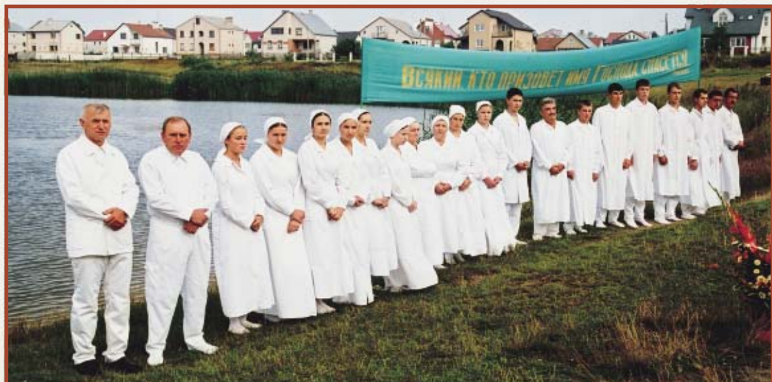
Бог подарил милость этим братьям и сестрам приобщиться к возлюбленной Церкви Христовой. 2005 г.