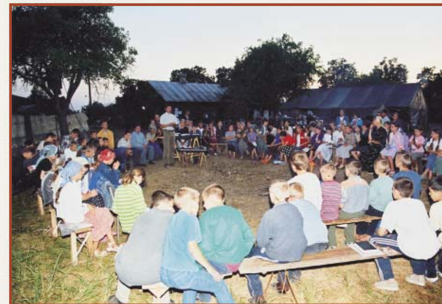
Помоги им, Боже, с ранних лет быть образцом святого хождения!

Несколько предыдущих лет Брестская церковь арендовала помещение, где проводились летние общения для детей, молодежи и родителей. В 2005 г. в помещении отказали. Церковь молилась, и Бог устроил все дела наши и чудным образом восполнил эту нужду (Ис. 26, 12). Он расположил сердце служителя предоставить усадьбу и дом, где раньше жили его родители (они уже в вечности) и где он провел детство. Рядом находился пустой дом другого верующего брата (он живет в городе). На этом хуторе поставили палатки, завезли все необходимое и в течение 7 дней провели четыре заезда: малые дети, средняя группа, подростки, отдельно девочки и мальчики (всего около 230 чел.). Затем два дня шло общение для родителей (присутствовало 250 семей) и следующие три дня — для молодежи. Служители и проповедники призывали детей и молодежь быть образцом во взаимоотношениях с родителями и со старшими (1 Тим. 4, 12). Бог благословил покаянием детей младшего и старшего возрастов.