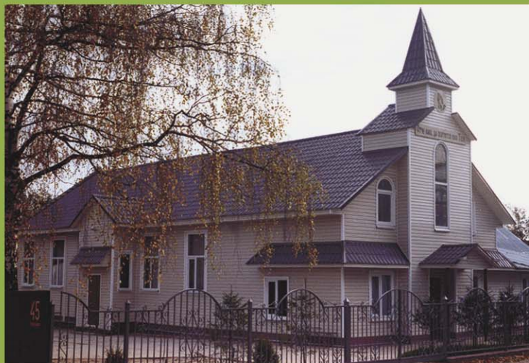
Молитвенный дом Дедовской общины МСЦ ЕХБ. г. Дедовск, Московская область