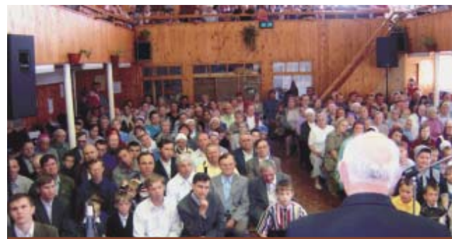
Прощальное богослужение в Пермской общине МСЦ ЕХБ.

считал таковых 1179 душ. Дай Господь, чтобы нашлись добрые наставники, которые подготовили хотя бы некоторых к вступлению в завет с Господом.