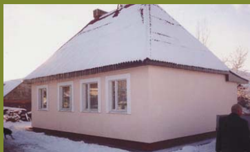
БЕЛОРУССКОЕ ОБЪЕДИНЕНИЕ МСЦ ЕХБ