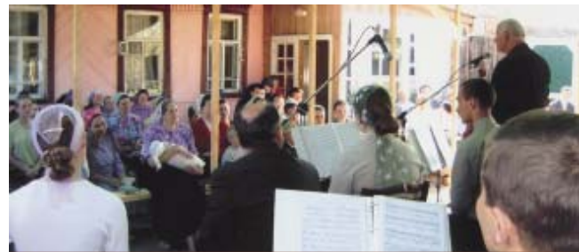
Призывное богослужение в дворе молитвенного дома, г. Орск.

Уральское объединение мне очень дорого. Господь позволил потрудиться в нём с 1967 по 1975 гг. Мы были весьма рады и даже удивлены большому числу вышедших каяться или обновить покаяние. Самый молодой сотрудник нашего оркестра брат Павел (мой двоюродный внук) на-