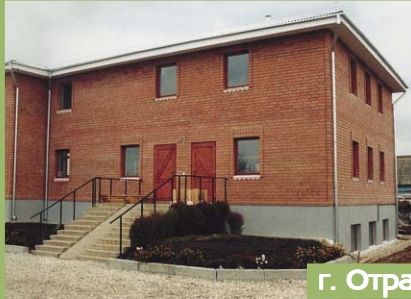
г. Отрадный, Самарская обл.