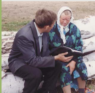
п. Базарский, Челябинская обл.