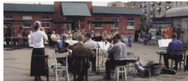
Евангелизационное служение в п. Тимирязево Челябинской обл.

К амерный оркестр МХО МСЦ ЕХБ со 2 мая по 8 июня 2005 г. совершал евангелизационное служение по Уральскому объединению. «В поездке в общей сложности мы были 37 дней. С Божьей помощью совершили 61 богослужение.