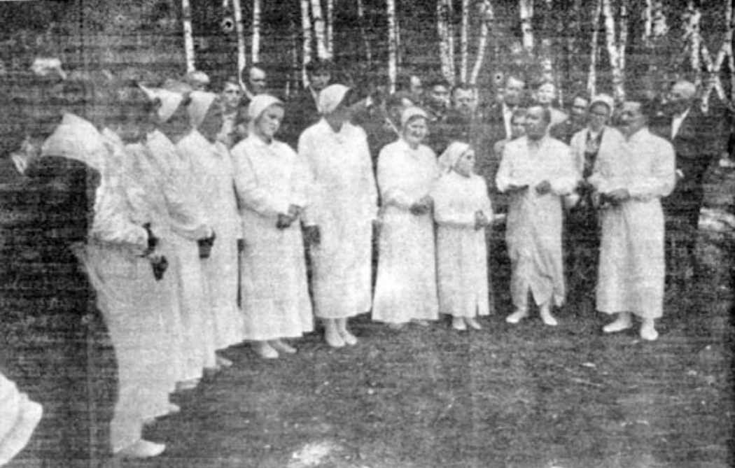
«Кто будет верить и креститься, спасен будет» Мрк. 16, 16

Я думаю, что ценность жизни человека определяется, во-первых, тем, насколько он познает истину;