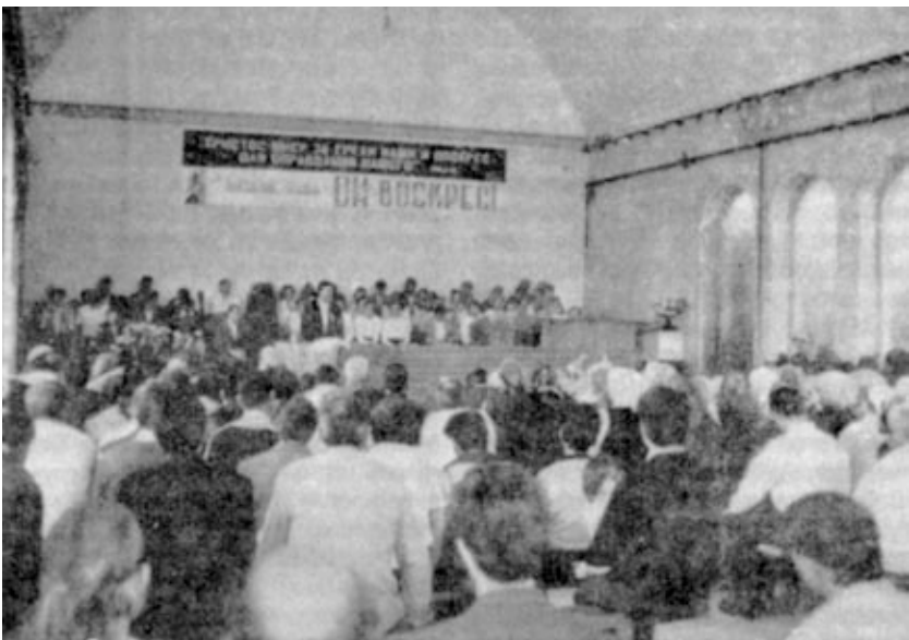
ТАШКЕНТСКАЯ ОБЩИНА СЦ ЕХБ (Богослужение в новом молитвенном доме.)