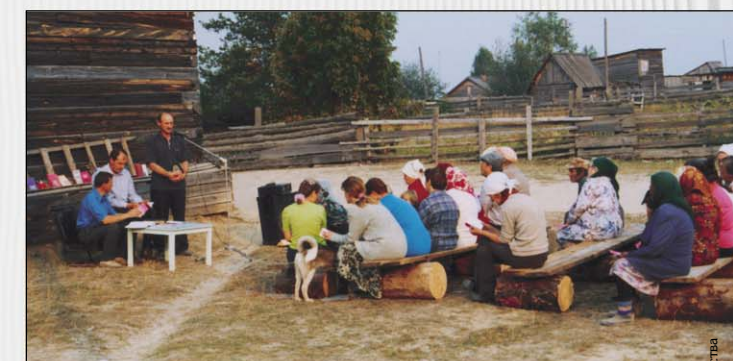
Слово спасения возвещается близким и дальним (п. Дальнее)