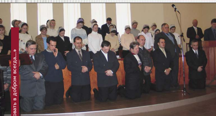
Группа благовествующих перед отъездом на евангелизационное служение (Санкт-Петербург)

Февраль 2004 года стал особо знаменательным и для Сыктывкарской церкви: Господь усмотрел в одном из посланных братьев верного труженика. После единогласного избрания церковью он был рукоположен на ответственное служение пресвитера. Да умудрит Господь молодого служителя с любовью и заботой пасти эту церковь (в ней 28 членов, есть приближенные).