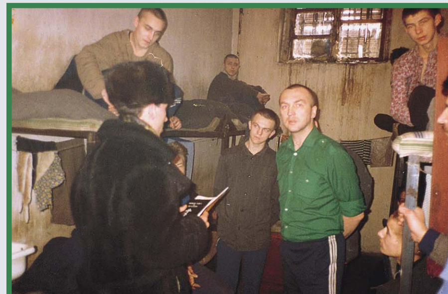
Благовестие среди заключенных — трудная нива (Новосибирск)

В последний день нашего пребывания в карцере я предложил ему помолиться.