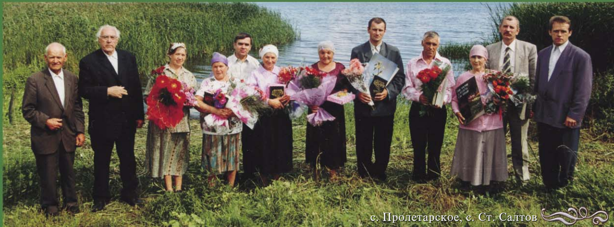
с. Пролетарское, с. Ст. Салтов