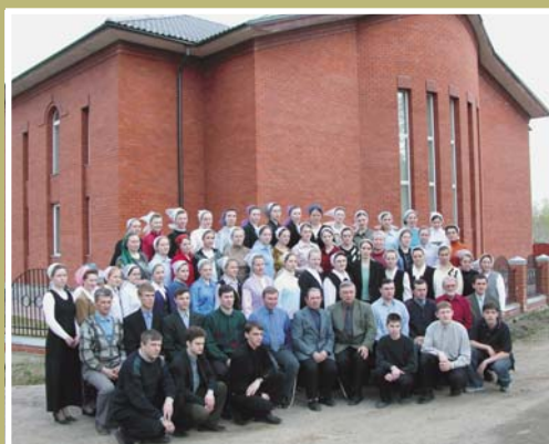
Они обучались славить Бога духовными песнопениями