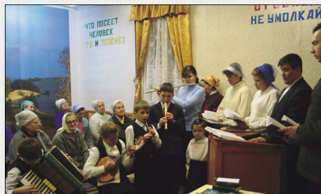
Юные музыканты прославляют Бога во время служения (Сокоп, Вологодская обл.)