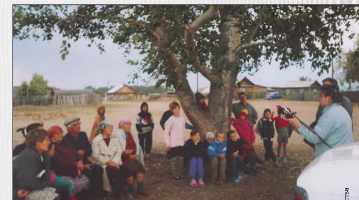
«Вера от слышания, а слышание от Слова Божия» (с. Садыкащы, Павногарская область)