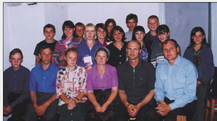
Группа благовестующих Колпашевской церкви (сидят) с молодежью п. Куржино

менной жизни. В свое время Христос обличал фарисеев за подобное лукавство. «Царица Южная восстанет на суд с родом сим и осудит его, ибо она приходила от пределов земли послушать мудрости Соломоновой...» (Матф. 12, 42).