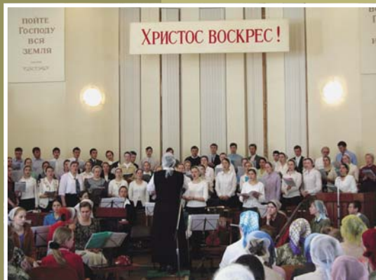
Сводный хор курсантов и мужской хор из Германии воспевали песни хвалы в доме Божьем