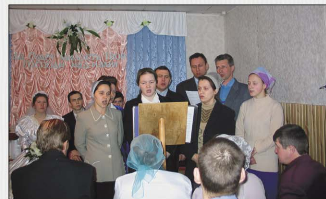
Первое в жизни церкви бракосочетание (Коряжма, Архангельская обл.)