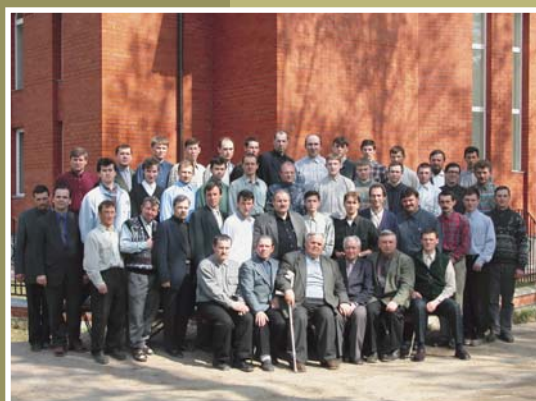
Ежегодные библейские курсы Северо-Западного объединения МСЦ ЕХБ