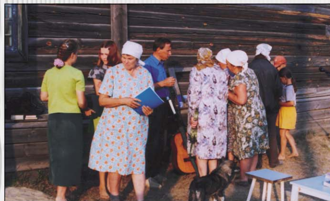
После служения в п. Дальнем желающим дарят христианские книги