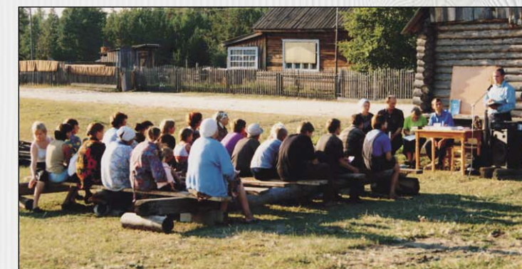
Благовестие в таежном поселке Куржино

Такие беспомощные инвалиды своим усердием поразляют здоровых, но нерадивых людей, придумывающих пустые отговорки лишь бы не прийти и не послушать слово спасения, а оно для грешника дороже вре-