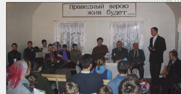
Во время богослужения в новом молитвенном доме (Мезень, Архангельская обл.)