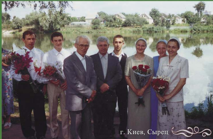
г. Киев, Сырец

(Вероучение евангельских христиан-баптистов)