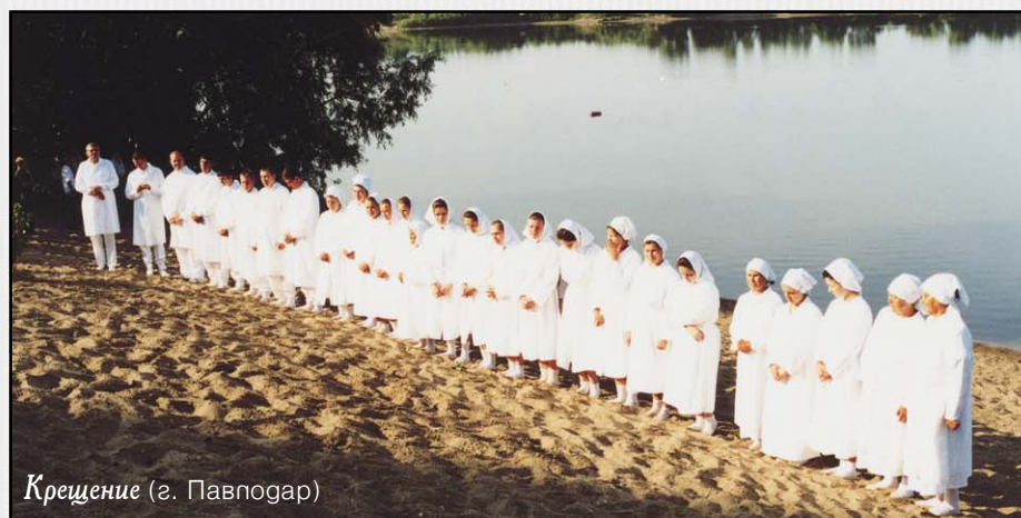
Крещение (г. Павногар)

Кроме того, от Павлодарской церкви в различные селения выезжают группы по 7–10 человек специально