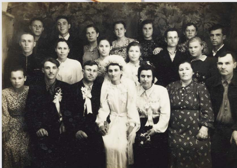
Господь на всю жизнь соединил нас, подарив единое сердце и один, узкий путь следования за Христом