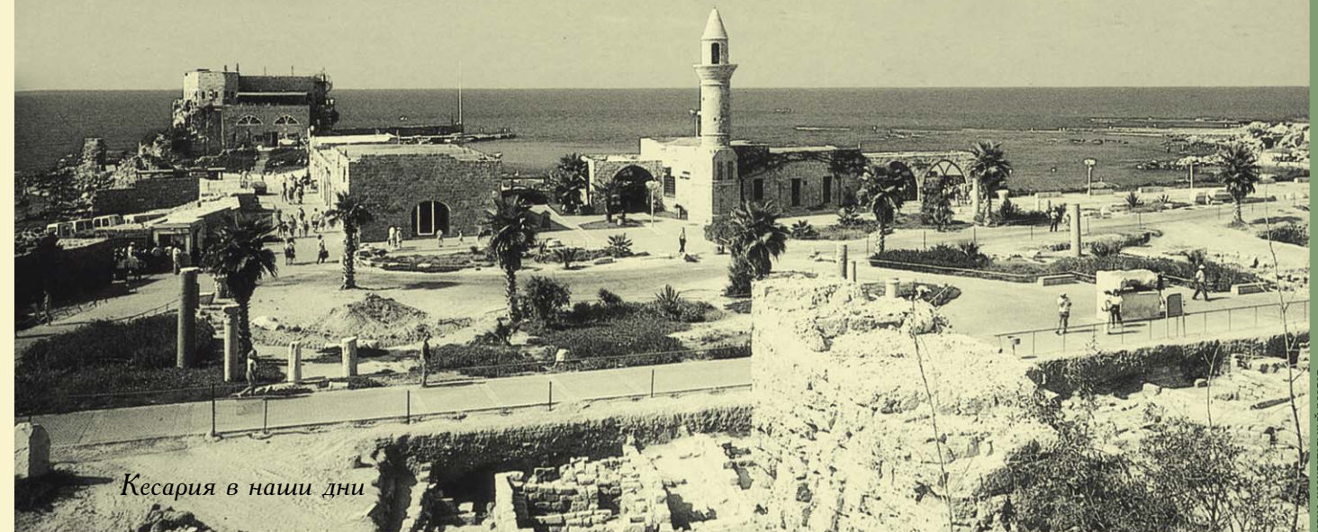
Кесария в наши дни