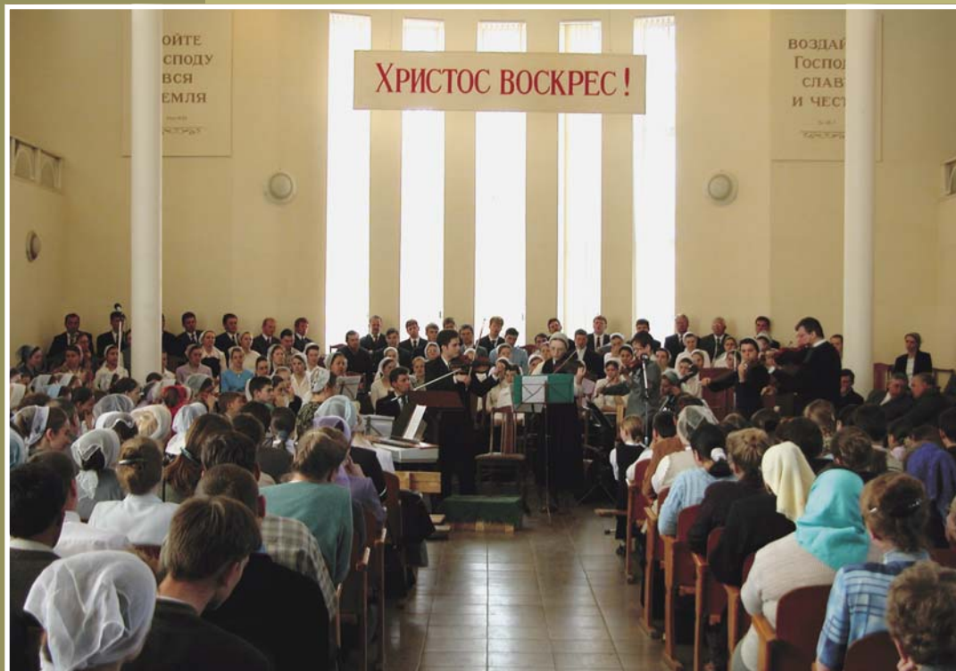
«Научайте и вразумляйте друг друга псалмами, славословием и духовными песнями, во благодати воспевая в сердцах ваших Господу»

В молодежном общении участвовал мужской хор из Германии и сводный хор курсантов, которые две недели обучались искусству христианского пения.