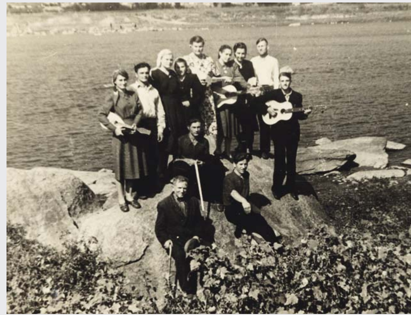
Молодые христиане Вознесенской церкви ЕХБ после благовестия в селах Николаевской области. 1956 г.

Считая себя малосведущим в Писании, я не осмеливался проповедовать в собрании. Когда приезжали с молодежным оркестром в села, там проповедовал. Мы обычно предупреждали верующих заранее. Они к назначенному времени приглашали неверующих родственников и соседей в свой дом. Господь благословлял наше усердие. Среди посетителей было много сельской молодежи. Жажда, с какой они слушали проповеди и духовное пение от та-