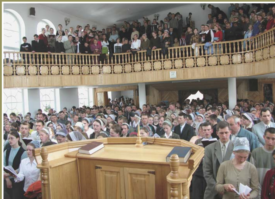
Как много спасенных! Только бы все исполняли волю Божию от души, служа Господу с усердием

Приводя библейские примеры жертвенного служения, братья призывали молодежь жить так, чтобы обрести Божье благоволение и отдавать Богу не остатки, а начатки от всех прибытков.