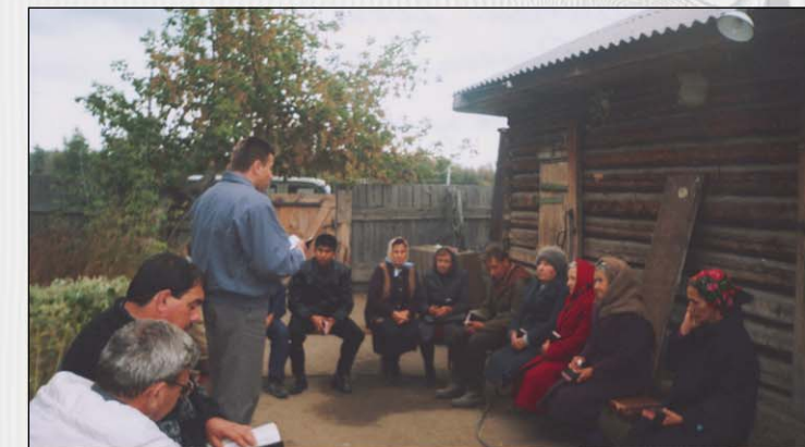
«Как веровать в Того, о Ком не слышали?» (Шангай, Павногарская область)

Всех, кто подвизается на Его ниве, да благословит Господь не считать главным личные нужды, но ободриться в служении нашему Господу и Спасителю, возвращения Которого мы ожидаем и перед Которым хотим предстать с добрыми плодами. "Производите работы!"»