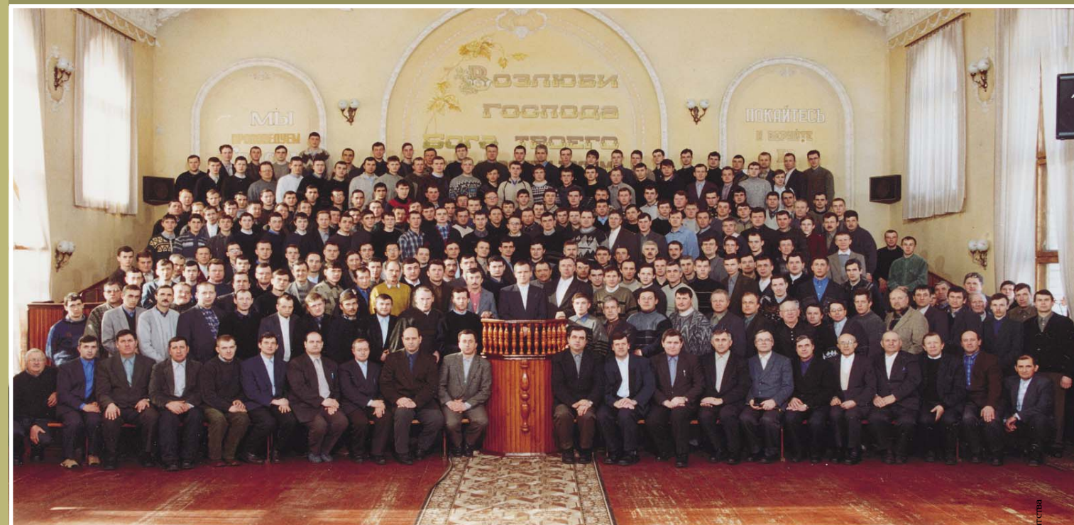
«Кто внимает в закон совершенный, закон свободы, и пребудет в нем, тот, будучи не слушателем забывчивым, но исполнителем дела, блажен будет в своем действовании»

Такое, значительно большее по составу и благословенное по духовной насыщенности, общение в Курске было впервые. Молодое поколение христиан, присутствующих на нем, по-особому ощутили, что значит независимое, идущее узким путем братство. Братья были из разных городов и общин, а Дух, сроднивший всех, Дух назидующий, вдохновляющий и объединяющий — один! Слава Богу!