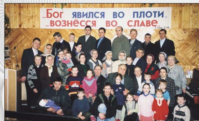
Церковь после рукоположения нового служителя (Сыктывкар)

Брат подумал и бесхитростно, просто процитировал