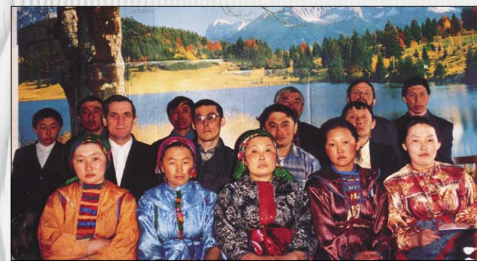
Молодые христиане из ненецкого народа со своим рукоположенным служителем (во втором ряду третий слева в очках) (Воркута)

наизусть: «Праведный печется и о жизни скота своего...» (Притч. 12, 10).