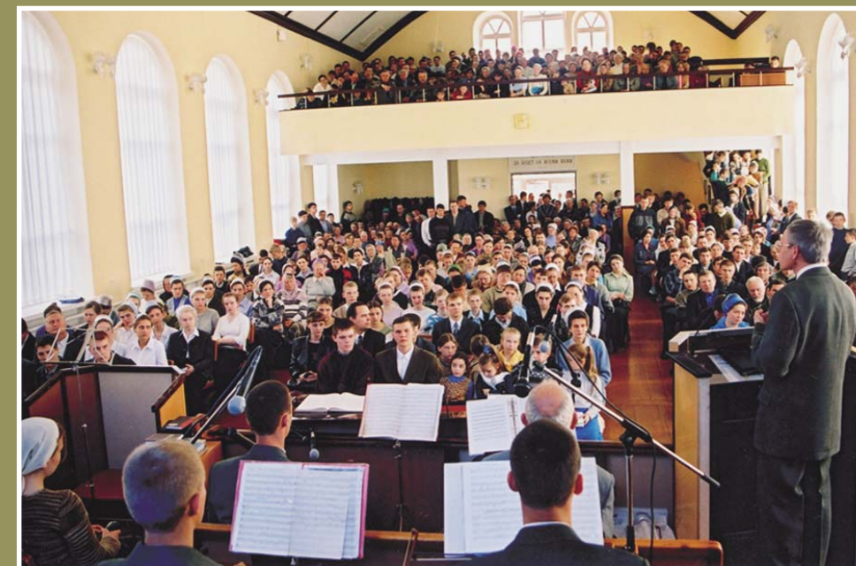
Молодых и сильных призывали следовать за Господом, отвергнув себя

Пение сводного хора и сладкозвучие духовной музыки и в остальное время общения принесли слушателям назидание и наслаждение.