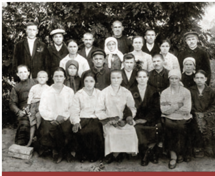
Журавская церковь в 1928 г.

От Журавской церкви евангельская весть распространилась в Лебедин, Капитановку, Буду, Макиевку, Липянку, Соболевку, Сигнаевку, Толмач, Петро-остров — даже до реки Синюхи.