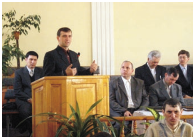
22-23 марта 2009 г. в Алма-Ате прошла конференция по благовестию.

Вся церковь заинтересована в приобщении к спасению новых людей, и это обстоятельство налагает большую ответственность на верующих за личное хождение перед Богом. Сознание того, что Бог не может пользоваться теми, чьё сердце нечисто, побуждает просить прощение друг у друга. Воля Божья не только