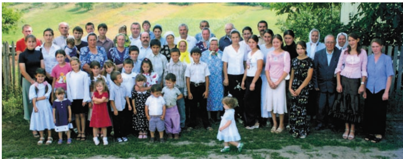
Журавская община МСЦ ЕХБ через 80 лет, 2008 г.

А Ему, возлюбившему нас и омывшему нас от грехов наших Кровию Своею, Владыке и Господу нашему, Главе Церкви, Спасителю Христу, — слава во веки веков! Аминь! ■