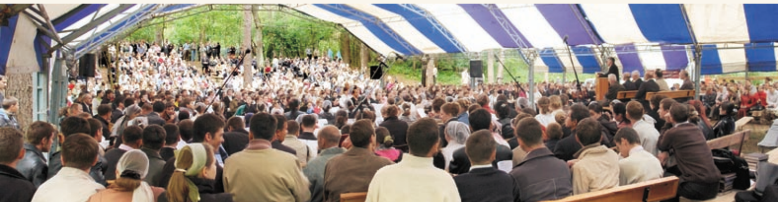
Общение христианской молодёжи Киевского объединения МСЦ ЕХБ.

Гедону, человеку веры, Господь обещал: «Я буду с тобою...» (Суд. 6, 16). В проповеди было обращено внимание на важную истину: «Когда церковь не извергает грех из своей среды, Господь оставляет её и предаёт в руки врагов. В таком положении оказались верующие ЕХБ в прошедших 40—60-х годах. Но когда прозвучал призыв к освящению и народ Божий очистился от грехов, тогда Господь в благости Своей