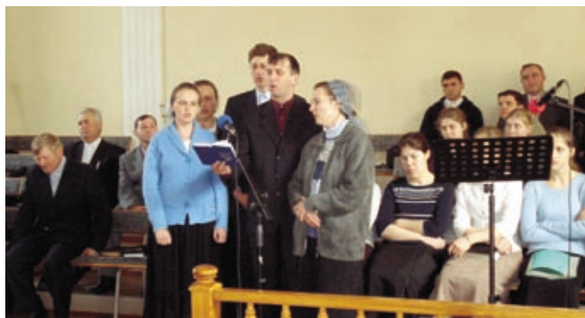
Прославляют Господа те, кто трудится на евангелизационных нивах вдали от родной церкви.

В дни, когда библиотека не работает, на этом месте висит объявление. Оно тускнеет и ветшает, заменяем новой вывеской. Проверяем: не сорвали ли? Было и такое. Сорвут, обязательно повесим другую.