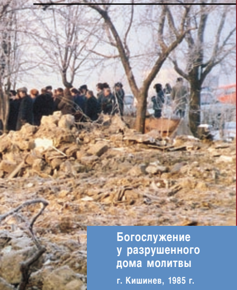
Богослужение у разрушенного дома молитвы