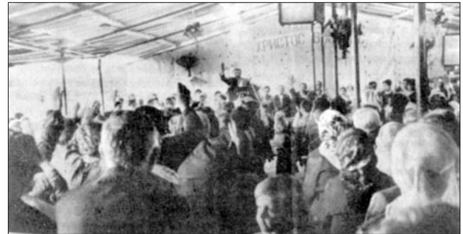
"КТО СОЗНАЕТ СЕБЯ ПОГИБШИМ ГРЕШНИКОМ?" — МНОГИЕ ВПЕРВЫЕ ПРИШЕДШИЕ НА ЕВАНГЕЛИЗАЦИОННОЕ СОБРАНИЕ ПОДНЯЛИ РУКИ.

Все проповеди, декламации, хорошее и сольное пение были подчинены единственной цели: во Христе может обрести спасение и жизнь вечную всякий, сознающий себя грешником! На призыв покаяться отозвалось более 80 человек. Каялись люди, пришедшие впервые, и те, кто уже слышал о Господе. Желающим раздали Евангелия, визитные карточки с адресами собраний. Покающихся просили посещать богослужения по месту жительства.