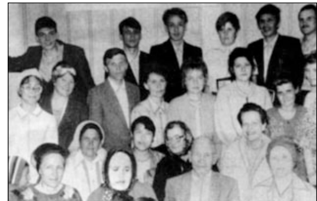
Община СЦ ЕХБ г. Жанатаса.

в милицию, в психбольницу и даже выгнали из дому. Господь укреплял веру брата, и вскоре обратились к Богу его сестра и брат с женой. Отец, увидев, какую добрую перемену совершил Бог в его детях, разрешил сыну вернуться домой. Сейчас церковь города Каскелена насчитывает около 20 членов.