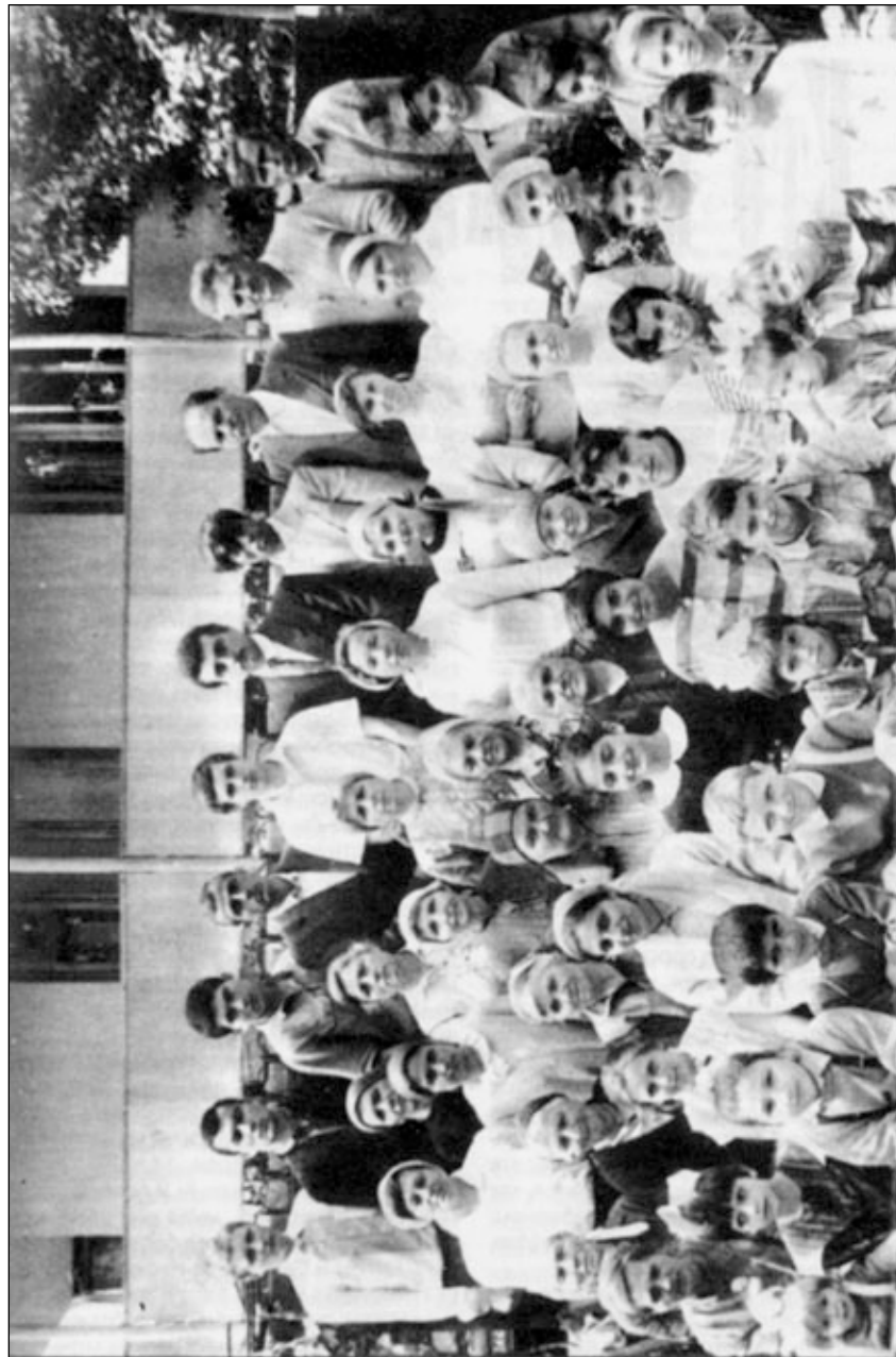
Община Совета церквей ЕХБ города Рустави (Грузия).

Несмотря на трудности, в 1993 году община отмечала праздник Жатвы, столы были накрыты скромно, но хвала Богу возносилась сердечная. Переживая сложную обстановку, братья и сестры не унывают, по мере сил принимают участие в деле Божьем и нуждаются в молитвенной поддержке народа Божьего.