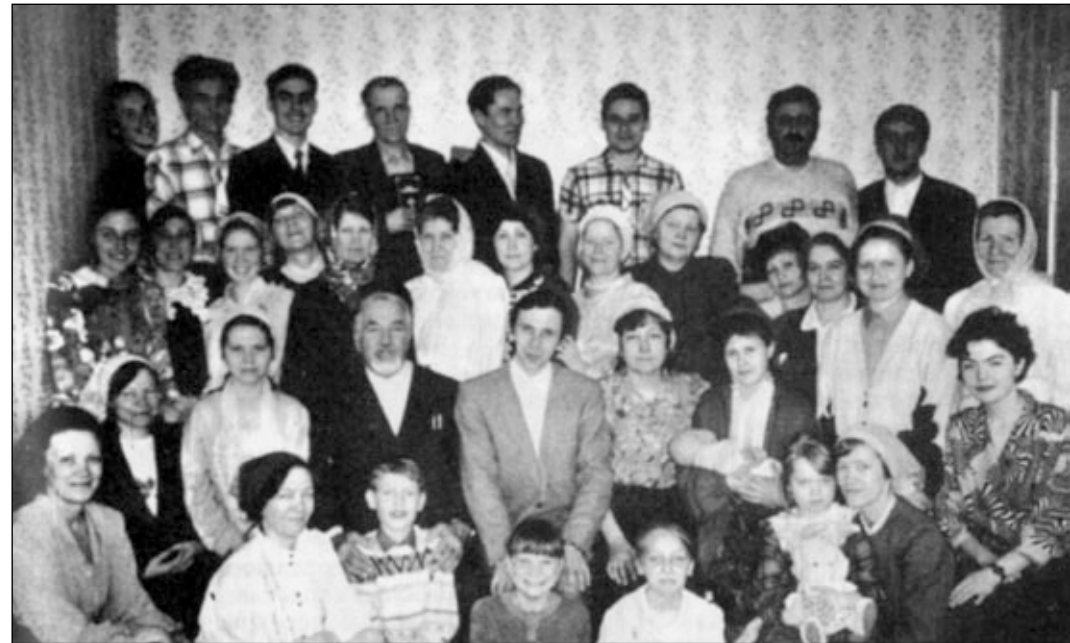
Община Совета церквей ЕХБ в г. Талнахе после освящения.

Когда в церквях Кайеркана и Талнаха проводилось служение очищения, приходили для исповедания и новообращенные. Они также испытали радостное обновление духовной жизни и сообщили о своем желании заключить завет с Господом через святое водное крещение. После проведения с ними бесед, 28 июля было совершено крещение — 7 душ присоединились к Церкви Христовой. Трое крещаемых было из Кайерканской церкви и четверо из Талнахской. У церквей был совместный праздник. Благословенно и торжественно совершена вечеря Господня. Прошло радостное общение небольшой частицы великого братства Господнего, маленькой части Тела Его на далеком и холодном Севере. Слава за это нашему Богу!