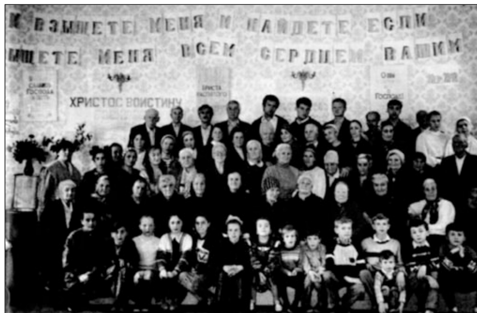
Община Совета церквей ЕХБ г. Тбилиси (Грузия).

Из-за возникших трудностей многие покинули церковь: кто уехал в Россию, кто в Америку. Хор опустел — уехал регент. Три брата проповедуют на русском, и три на грузинском языке. Проводятся занятия с детьми (их 20 душ), есть детский хор. Работает выносная христианская библиотека. Книги берут около 700 человек. Многие читатели посещают богослужения, есть среди них и обращенные. В 1993 году более десяти человек вступили в завет с Господом, и в 1994 —