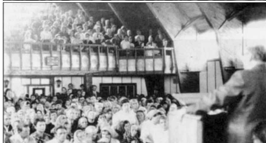
Торжественное богослужение в новом молитвенном доме г. Белая Церковь.