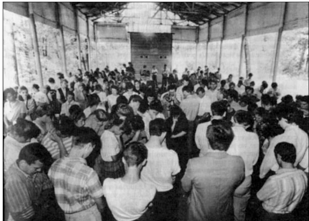
Волнующий момент шестидневного молодежного общения в Черкасской области, когда более 100 человек обратилось с покаянием к Богу.

Об этом молодежном общении было вознесено много молитв (с постом) в тех