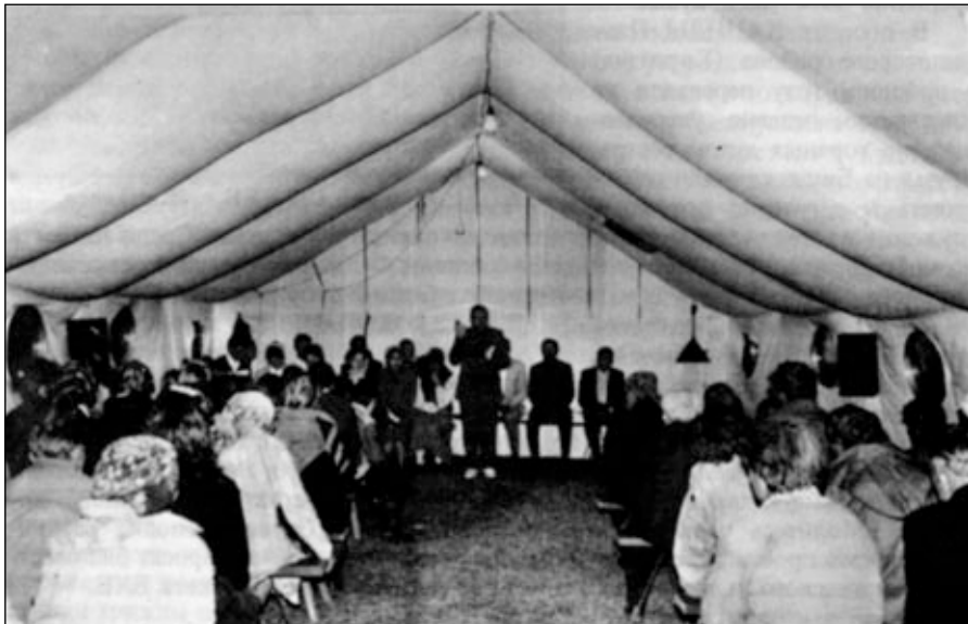
Богослужение в евангелизационной палатке в поселке Лепсинск.

Поселок ЛЕПСИНСК (600 км от Алма-Аты) расположен в живописной долине между отрогами Джунгарского Алатау в 30 км от китайской границы. Поскольку этот район пограничный, въезд туда возможен только по пропускам. Но Господь позволил группе благовествующих летом 1994 года восемь дней совершать там евангелизационное служение в установленной палатке. Проживают в поселке в основном татары и семиреченские казаки, предки которых 200 лет назад прибыли сюда из Донских степей. Около 20% населения составляют казахи. Люди,