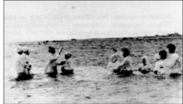
Крещение в Бакинской общине СЦ ЕХБ.

Большая часть территории Туркменистана занята пустыней Каракумы. Она как бы рассклала республику на две части, что усложняет не только жизнь в этих местах, но и передвижение. Проезд на поезде от одного конца республики до другого — около суток. Климат — резко континентальный, засушливый, с палящим летним зноем +45°; количество осадков — минимальное, преимущественно