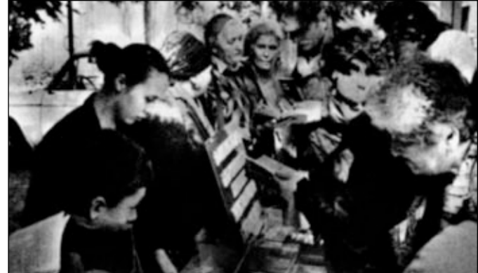
Христианская библиотека общины СЦ ЕХБ г. Тбилиси.

Обстоятельства, в которых мы живем, сложные: заработанных денег едва хватает на хлеб (его выдают по карточкам 400 гр на человека) и для уплаты за проезд в городском транспорте. Из-за частых перебоев в работе транспорта на вечернее воскресное богослужение приходит мало людей (а утром всегда многолюдно), но, несмотря ни на что, богослужение никогда не отменяются.