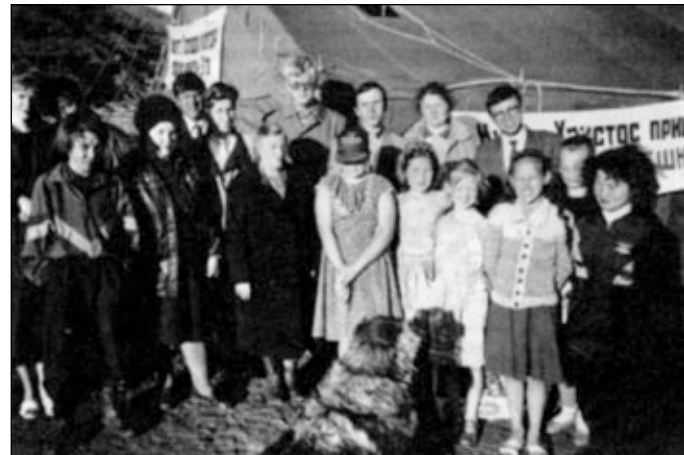
Постоянные посетители богослужений в п. Караул вместе с группой благовестия.

ли сознание. В этот момент им выливали на голову воду из таза — и это считалось крещением. За такое крещение жители платили крупную сумму денег, так как группа харизматов работала на коммерческой основе. Подобное извращенное служение оттолкнуло от Бога многие искренние души, поэтому появление в поселке благовестников нашего братства жители расценили как очередное нашествие еретиков. В сердце братьев закралось сомнение, что изменить настроение людей будет невозможно. Но Бог по Своей великой милости к погибающим грешникам смягчил их души. Люди увидели разницу между истинным служением Богу и христианизированным «спектаклем» в прошлом году. Несмотря на холодную погоду, люди приходили на евангелизационные служения. С помощью Божьей в поселке образовалась небольшая группа новообращенных, желающих в дальнейшем продолжать собираться для изучения Слова Божьего. В этом поселке у братьев была интересная встреча с одним из жителей. Он обратился к Богу в тундре, читая подаренное Евангелие. Слово Господне коснулось его сердца. Он не знал, как нужно каяться, и просто стал на колени и говорил с Богом, как разговаривают с человеком. Встретившись с ним, братья спросили: молится ли он? — «Я не знаю никаких молитв,— ответил покаявшийся,— и разговариваю с Богом обо всем, что теснит мою душу. С того момента, как я стал на колени в тундре, жизнь моя совершенно изменилась. Я очень люблю Евангелие...» Братья радовались, слыша волнуемое свиде-