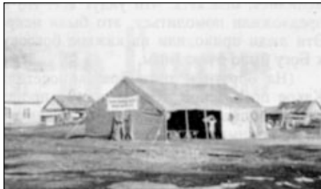
Евангелизационная палатка в п. Усть-Порт.

в поселок УСТЬ-ПОРТ. Как и многие другие, он расположен на холме, чтобы река, разливаясь, не затопила дома. Доставить евангелизационную палатку на гору вручную было бы очень трудно. Но забота Небесного Отца и здесь была явлена чудесным образом: в этот же день прибыла баржа с грузом и плавкран. Обслуживающие их люди с большим расположением погрузили евангелизационную палатку на машину и доставили в поселок.