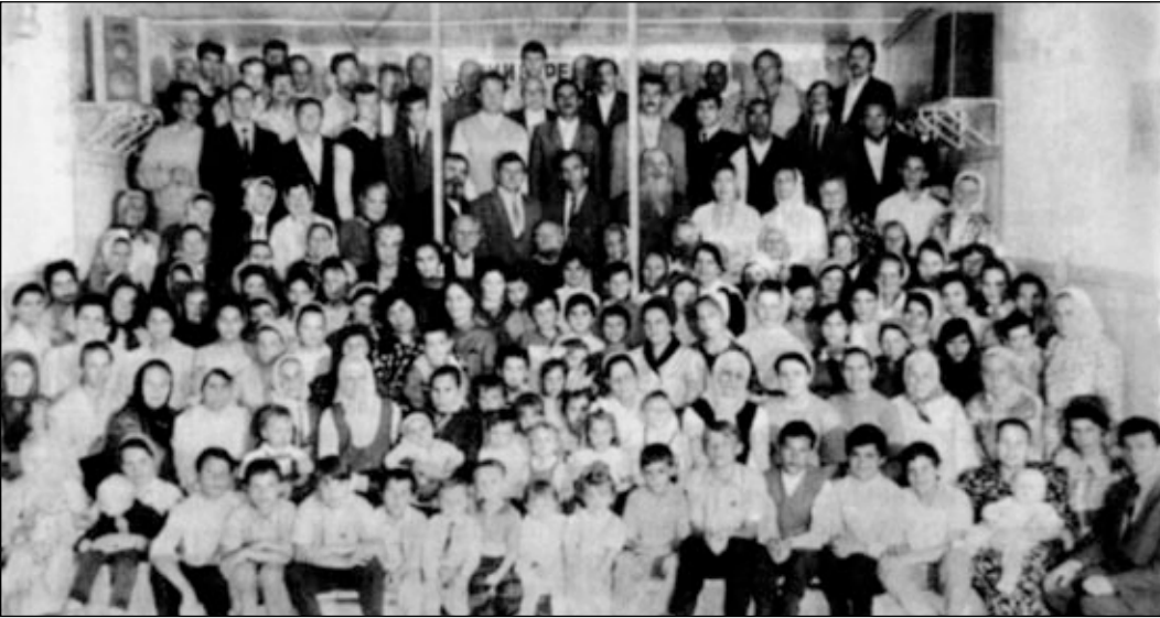
Община Совета церквей ЕХВ г. Сумгаита (Азербайджан).

нет возможности приобрести необходимые продукты питания, не говоря уже о медикаментах. Братья и сестры были очень рады и благодарили Бога за