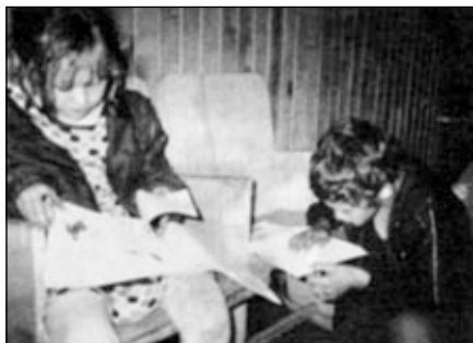
Дети из поселка НОСОК впервые видят христианские книги.

Затем с проповедью Евангелия они посетили поселок НОСОК. Вокруг него — сплошные болота. Жителям приходится передвигаться по поселку по