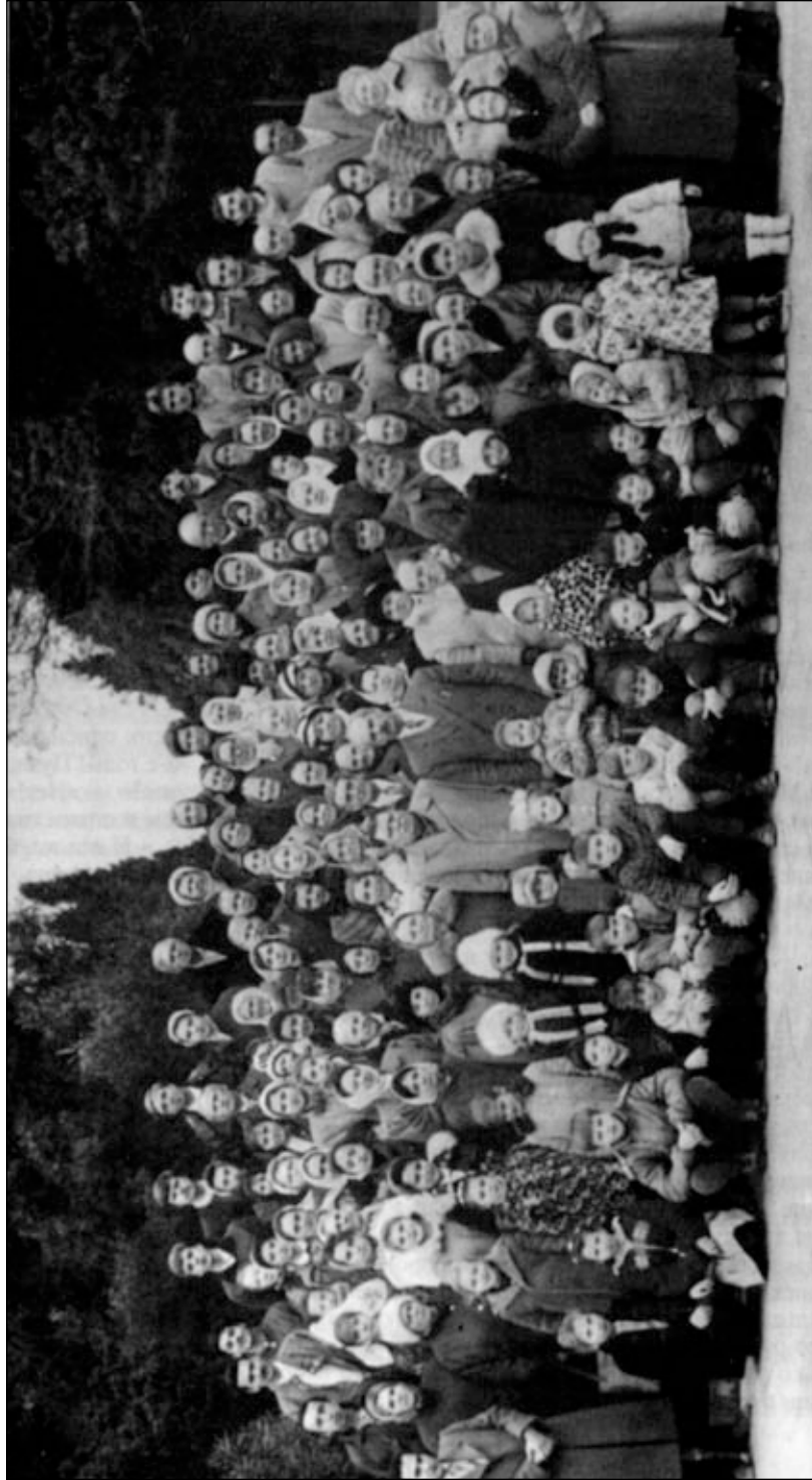
Бакинская община Совета церквей евангельских христиан-баптистов.

стианами из азербайджанцев беседовал с местными жителями. Русский брат и в познании духовных истин был сильнее и не в меньшей степени старался убедить людей принять Христа. «Но я вижу, — говорил брат, — что они меня не слушали так, как слушали своих соотечественников. То, что говорят азербайджанцы азербайджанцам, — это свое, это гораздо ближе и убедительней».