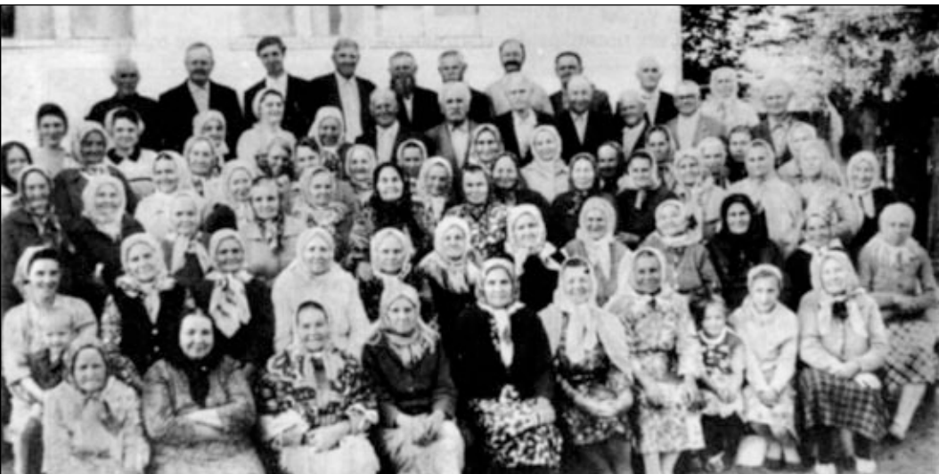
Верующие общины СЦ ЕХБ с. Ивановки (Азербайджан).