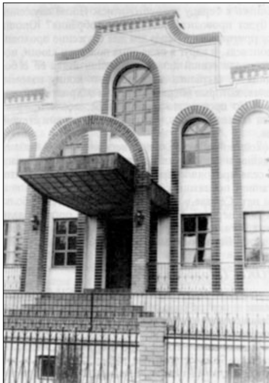
Внешний вид молитвенного дома общины СЦ ЕХБ г. Белая Церковь.

11 сентября 1994 г. в общине Совета церквей ЕХБ города БЕЛАЯ ЦЕРКОВЬ (Киевское объединение), насчитывающей более 270 членов, был большой праздник — освящение нового молитвенного дома. В строительство этого здания вложено много усердного труда ревностных детей Божьих: дом большой (12х24), отделан красиво и выглядит величественно.