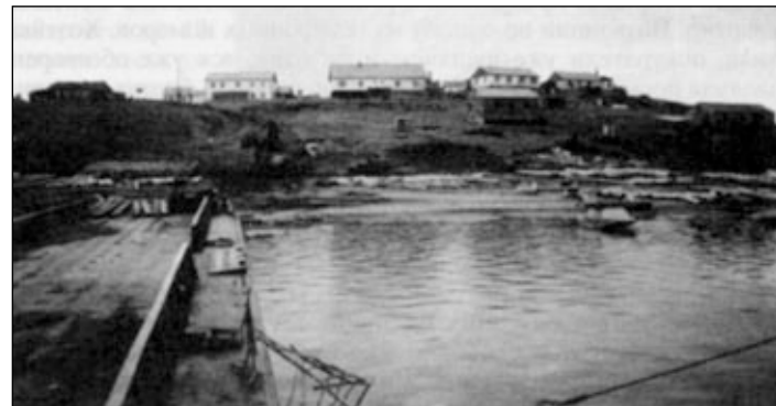
Поселок НОСОК. Жители его с надеждой ожидают благовестников.

ли сознание. В этот момент им выливали на голову воду из таза — и это считалось крещением. За такое крещение жители платили крупную сумму денег, так как группа харизматов работала на коммерческой основе. Подобное извращенное служение оттолкнуло от Бога многие искренние души, поэтому появление в поселке благовестников нашего братства жители расценили как очередное нашествие еретиков. В сердце братьев закралось сомнение, что изменить настроение людей будет невозможно. Но Бог по Своей великой милости к погибающим грешникам смягчил их души. Люди увидели разницу между истинным служением Богу и христианизированным «спектаклем» в прошлом году. Несмотря на холодную погоду, люди приходили на евангелизационные служения. С помощью Божьей в поселке образовалась небольшая группа новообращенных, желающих в дальнейшем продолжать собираться для изучения Слова Божьего. В этом поселке у братьев была интересная встреча с одним из жителей. Он обратился к Богу в тундре, читая подаренное Евангелие. Слово Господне коснулось его сердца. Он не знал, как нужно каяться, и просто стал на колени и говорил с Богом, как разговаривают с человеком. Встретившись с ним, братья спросили: молится ли он? — «Я не знаю никаких молитв,— ответил покаявшийся,— и разговариваю с Богом обо всем, что теснит мою душу. С того момента, как я стал на колени в тундре, жизнь моя совершенно изменилась. Я очень люблю Евангелие...» Братья радовались, слыша волнуемое свиде-