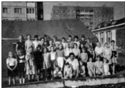
После призывного детского собрания в г. Кайеркане.

Взрослых на богослужение приходило столько, что иногда не хватало мест — многие слушали стоя. (Кроме того, усилитель позволял слушать жителям соседних 9-этажных домов проповеди и христианское пение не выходя из квартир.)