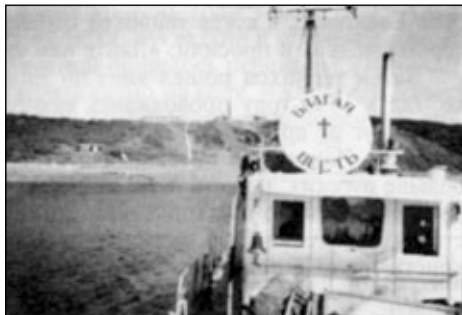
Теплоход «Благая весть» в рыбацком поселке КАЗАНЦЕВО.

4 июля вечером теплоход «Благая весть» прибыл в районный центр — поселок КАРАУЛ. От других он отличается тем, что здесь живет много русских и немцев. Он крупнее и благоустроенней. Однако для благовестия это место оказалось самым трудным. Дело в том, что в 1993 году харизматы из Норильска в течение 10 дней проводили здесь христианизированные представления. Многих жителей они обещали исцелить, но так никого и не исцелили. Совершали крещение в поселковой бане. Женщин крестили в ночных рубашках. Заставляли их произносить никому не понятные слова, держать руки поднятыми вверх. Некоторые из них теря-